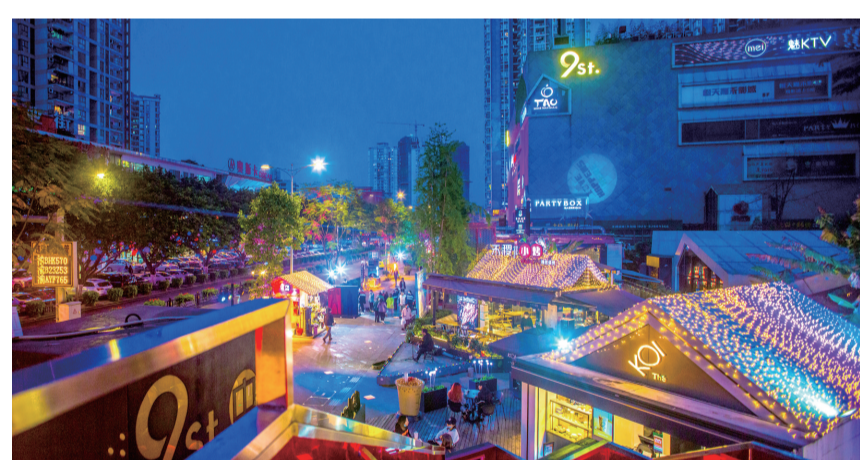
不夜九街

开放时尚之地,必然也是消费中心。为此,江北将升级发展商贸业,打造国际消费中心城市首选区。构建观音桥国际知名商圈、江北嘴国际高端商