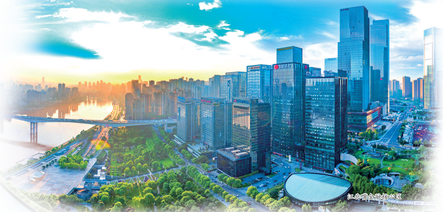
江北科学城核心区