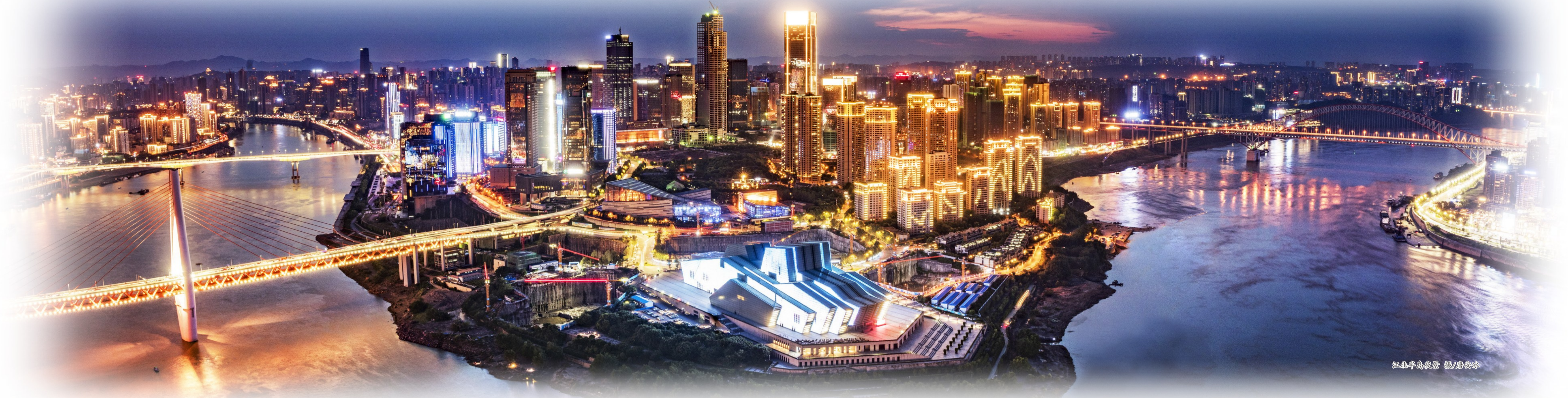
江北半岛夜景