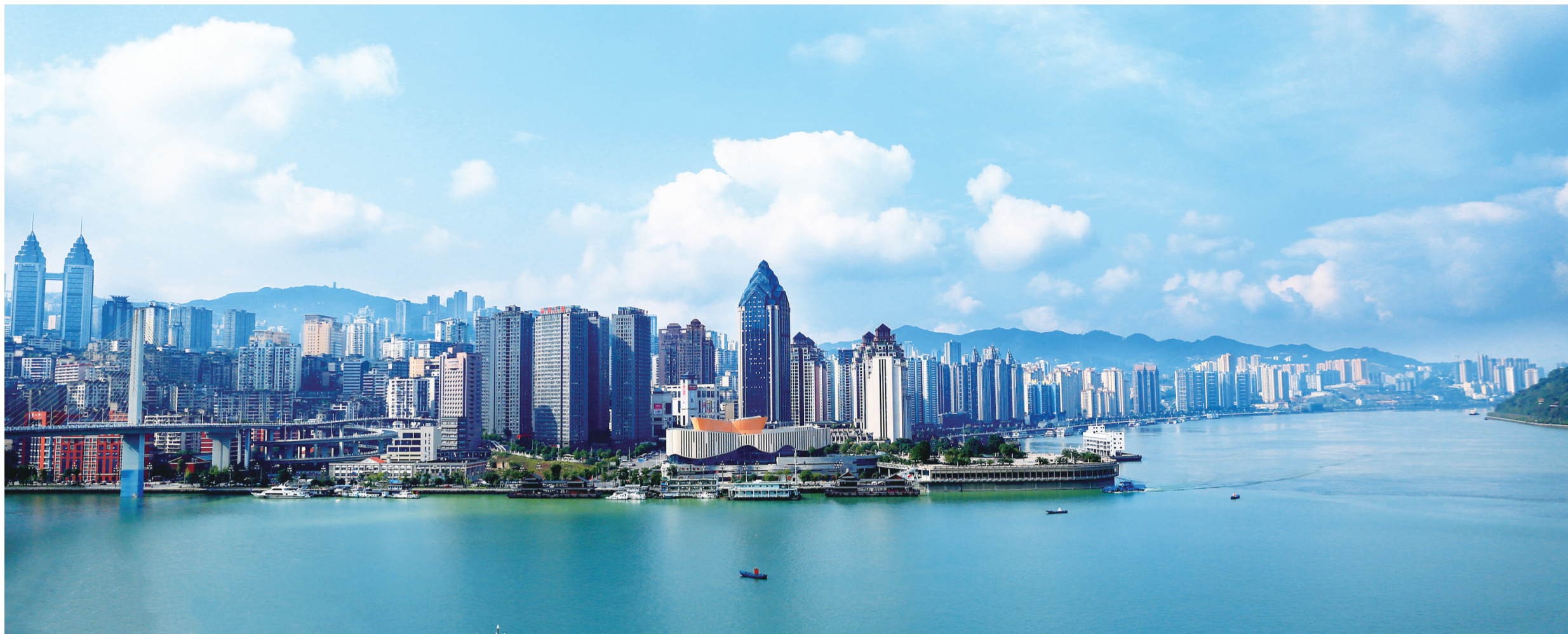
两江福地 神奇涪陵 产业强区 创新高地