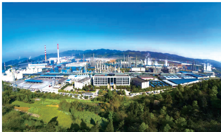
位于涪陵白涛新材料科技城的华峰集团

“我们突破了己二腈生产技术壁垒，打破国外技术垄断，对保障国内尼龙66供应链安全具有重要意义。”涪陵华峰集团相关负责人介绍，未来几年，中国将成为全球最大的尼龙66消费市场，但多年来，己二腈未能实现国内自主供应，生产技术一直被少数跨国公司垄断。由于长期受制于国外厂商，严重限制和影响了我中国最大的民营企业薄板生产基地，镀锌板产销量位居全国民营企业第一。