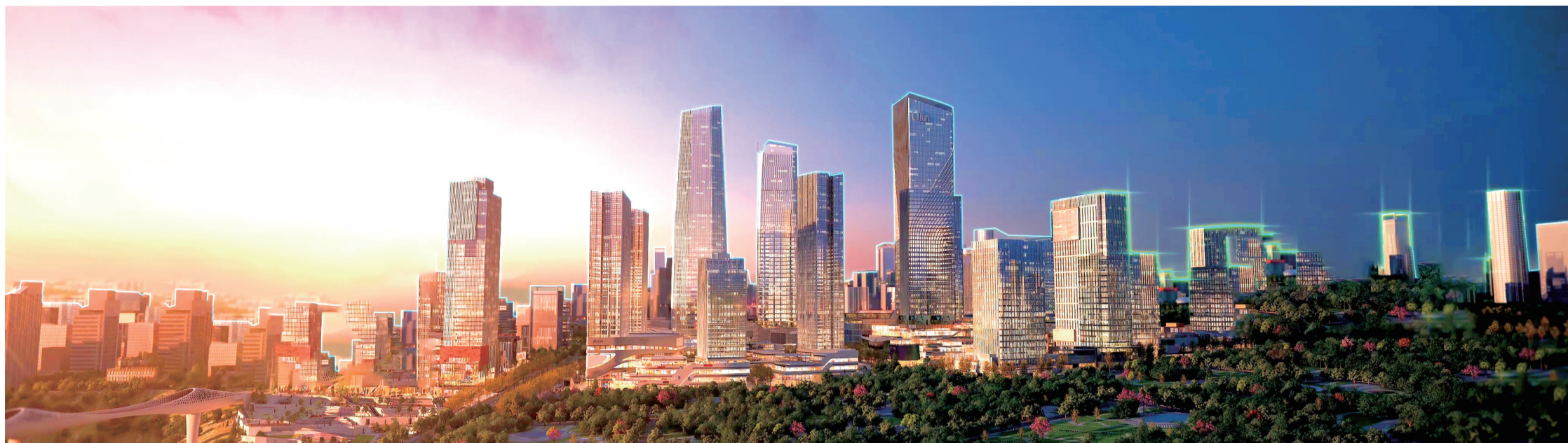
重庆两江国际商务中心效果图

与传统商圈不同，三大商业综合体零售卖场占比不到50%，更多的是特色餐饮、亲子游乐、潮玩时趣、沉浸式体验等引领新消费的新业态。市民来到这里，就像进入超级体验中心，享受一站式“吃喝玩乐游赏购”的乐趣。