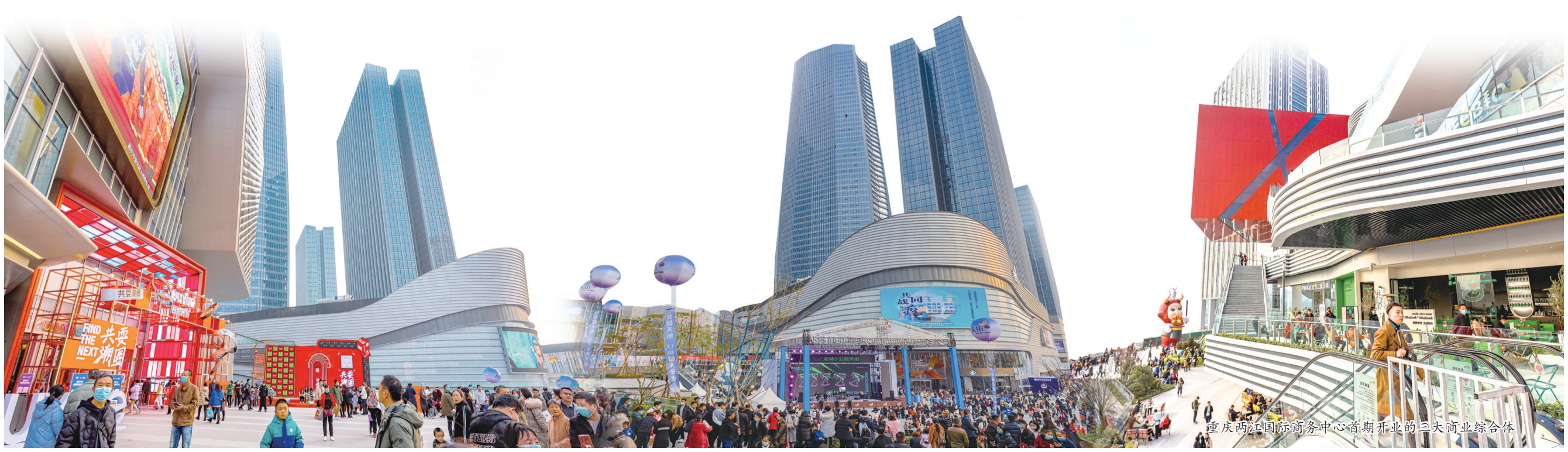
重庆两江国际商务中心首期开业的三大商业综合体