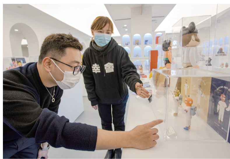
渝北吾悦广场潮玩店里，工作人员为市民介绍玩具

都有深度合作的艺术、衍生品集合店FunnerART，代理众多潮圈大牌的OSSANCH，汇集全球高街潮流品牌及国际设计师品牌的OOXOO，西南首家迪士尼IP全品类店等。此外，商场和潮流品牌进行共创发布，将商业空间营造为艺术家和收藏者连接的场域。比如在开业期间，携手幸会潮玩签约代理设计师品牌CIRCUS BOY BAND，将剧场系列手办Horangi和剧场盲盒款OREE重庆潮流融合创作，发行重庆潮玩限定数字藏品，以这种前沿的方式与重庆潮人对话。