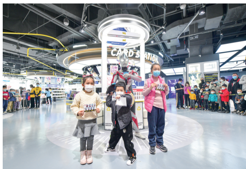
龙湖重庆公园天街欧布奥特曼见面会上，小朋友和奥特曼合影

了多龄层一站式儿童成长体验空间，家长可带着孩子尽情地玩乐。同时，公园天街还举办城市节奏艺术节、一年一度流行舞蹈嘉年华、10米龙小湖飞天巡游、卡游欧布奥特曼见面会等活动，为市民送上了一场盛大的跨年盛会。