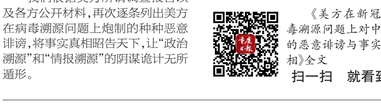
《美方在新冠病毒溯源问题上对中国的恶意诽谤与事实真相》全文 扫一扫 就看到

一段时间以来，美方在病毒溯源问题上针对中国炮制了种种谎言谣言，早已多次被中方和国际社会以详细事实和数据打脸。迄今已有80多个国家，300多个政党、社会组织 and 智库以各种方式反对溯源问题政治化。 近日，美国情报部门发布所谓新冠病毒溯源问题解密版报告，继续罔顾科学溯源规律，影射“武汉病毒研究所泄漏病毒”，指责中方缺乏透明度、阻挠国际调查。溯源是一个科学问题，美方动用情报部门搞溯源，将早已遭到批驳的低劣谎言披上情报“马甲”反复翻炒，真实目的就是妄图混淆视听、蒙骗世人，继续搞“有罪推定”，政治操弄溯源问题，对中国甩锅推责、打压遏制。 我们根据美方所谓调查报告以及各方公开材料，再次逐条列出美方在病毒溯源问题上炮制的种种恶意诽谤，将事实真相昭告天下，让“政治溯源”和“情报溯源”的阴谋诡计无所遁形。