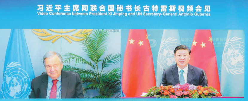
10月25日上午,国家主席习近平在北京人民大会堂以视频方式会见联合国秘书长古特雷斯。

新华社北京10月25日电 国家主席习近平25日上午在北京人民大会堂以视频方式会见联合国秘书长古特雷斯。中共中央政治局常委、中央书记处书记王沪宁参加会见。