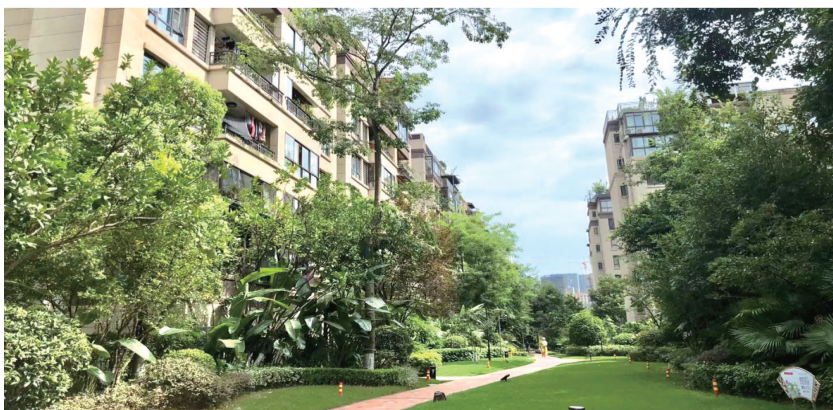
汇祥林里3000三期实拍图

值得一提的是,新凯美物业服务集团还特别将这79项焕新措施在小区进行了公示,并邀请热心业主组建业主监督小组,参与重要举措的讨论、实施与监督。整个改善过程业主全程