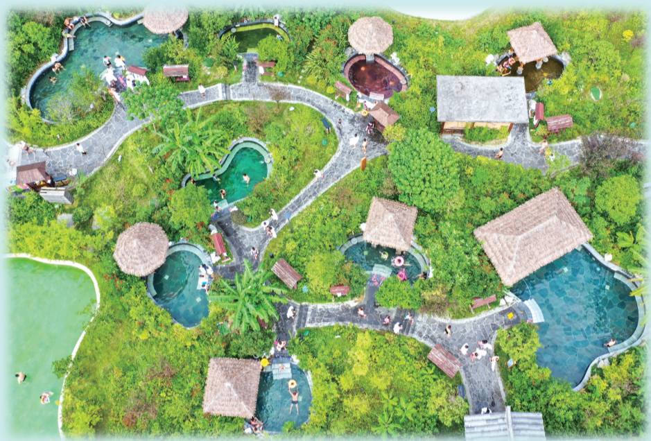
天星温泉