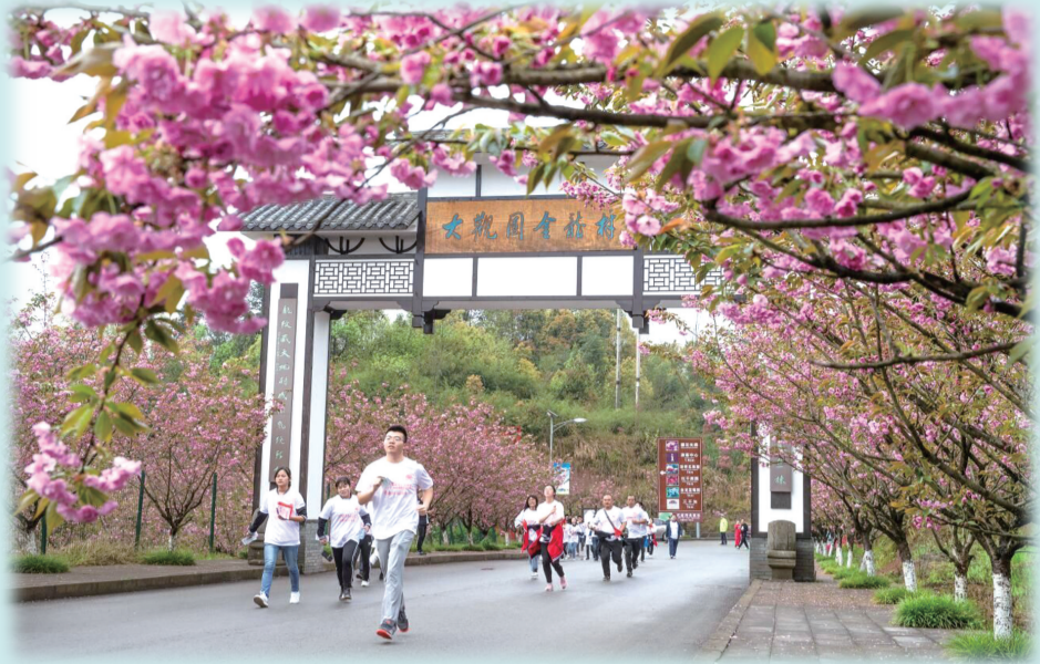
花海田园跑