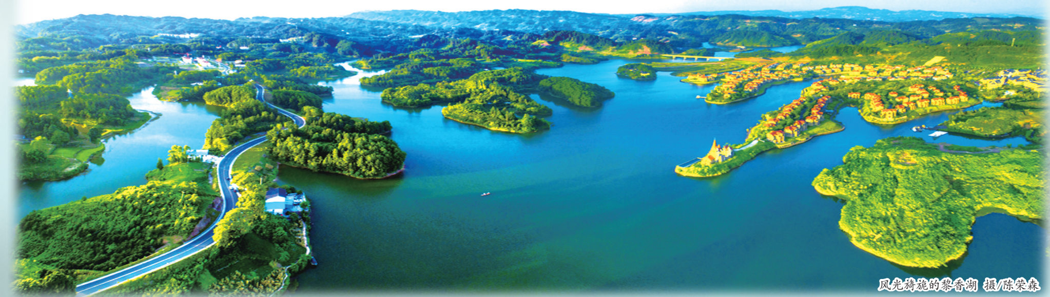
风光旖旎的黎香湖

川康养“锦上添花”。 截至2019年,共有3万余人在南川购置物业长期居住。加上农家乐租住等形态,南川全年休闲避暑人数超过20万人,位居主城区各大休闲避暑、旅游康养地前列。2020年,全区销售康养度假物业(含认购)16.93万平方米,金额12.71亿元。