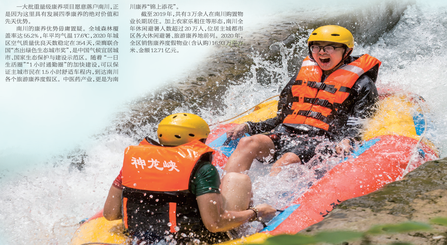
神龙峡漂流