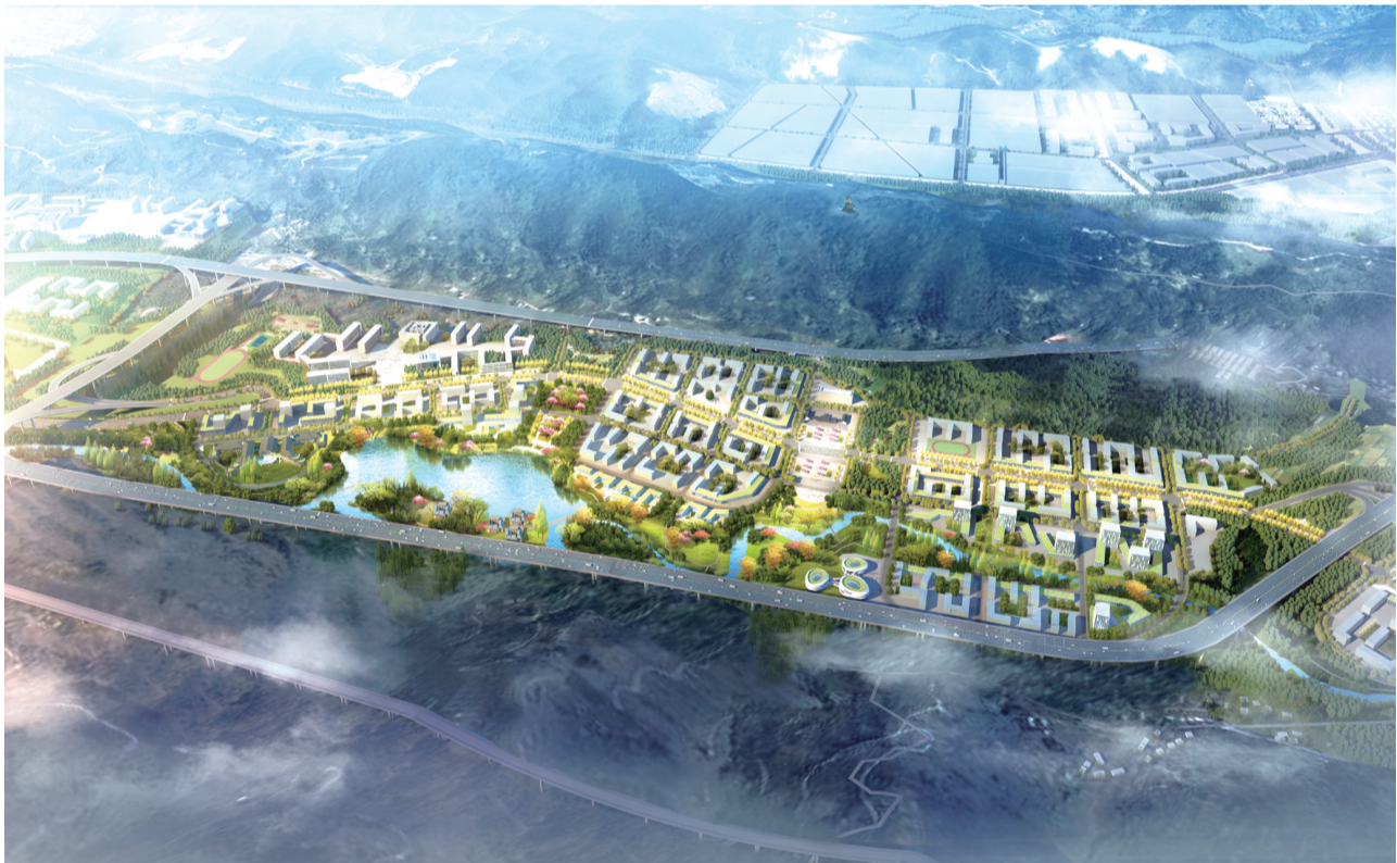
綦万城市设计效果图

据介绍,由东方电气集团投资的氢能产业生产经营基地项目,涵盖氢燃料电池制造、可再生能源发电及制氢、工业废氢利用、分布式能源系统、氢能源综合能源站、氢燃料车辆示范及推广等。 其中,氢能产业示范园项目占地45亩,涵盖制氢、储运氢、加氢、燃料电池生产制造,并根据市场情况打造年产能达2000套燃料电池系统生产线,可带动培育形成100亿规模的高质量氢能核心产业。 在氢能基础设施建设方面,东方电气集团将牵头在綦江区配套建设加氢、加油综合能源站,为氢能示范公交、氢能城际大巴、氢能物流车等提供加氢服务。 在多元化燃料电池特色示范应用方面,东方电气集团将支持綦江区开行特色的氢燃料公交示范应用,打造燃料电池物流应用基地及具备西部影响力的氢燃料车辆综合应用城市。 此外,东方电气集团还将在綦江打造重庆地区首个氢燃料分布式供能中心,同时在綦江开展风电、水电可再生能源发电项目建设,投资建设垃圾焚烧耦合制氢产业园,协助綦江制定氢能、环保、新能源等产业规划。 “这是一个科技含量非常高、市场前景非常大的产业!”綦江区相关负责人介绍,氢燃料电池汽车是新能源汽车最好的发展趋势之一,氢燃料电池汽车的燃料是氢和氧,生成物是清