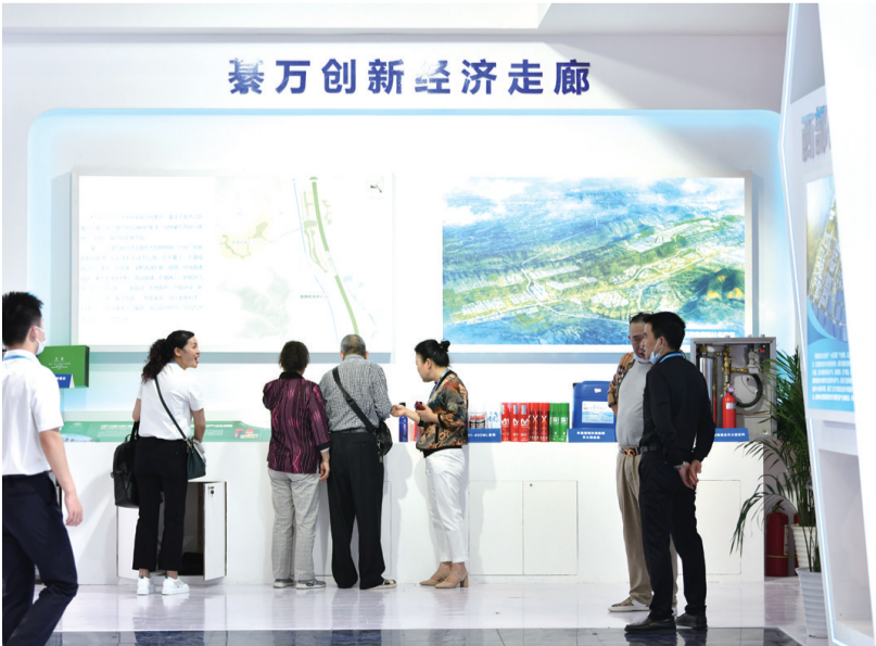
西洽会上,市民在綦江展厅参观

另外,綦万创新经济走廊(永城片区)还拥有革命烈士王良等厚重文化资源。王良是綦江区永城镇人,担任过红四军军长,在25岁任职师长时率部活捉了敌军前线总指挥张辉瓒,取得了红军第一次反“围剿”的巨大胜利,王良同志纪念馆(一期)将于近期正式开馆。