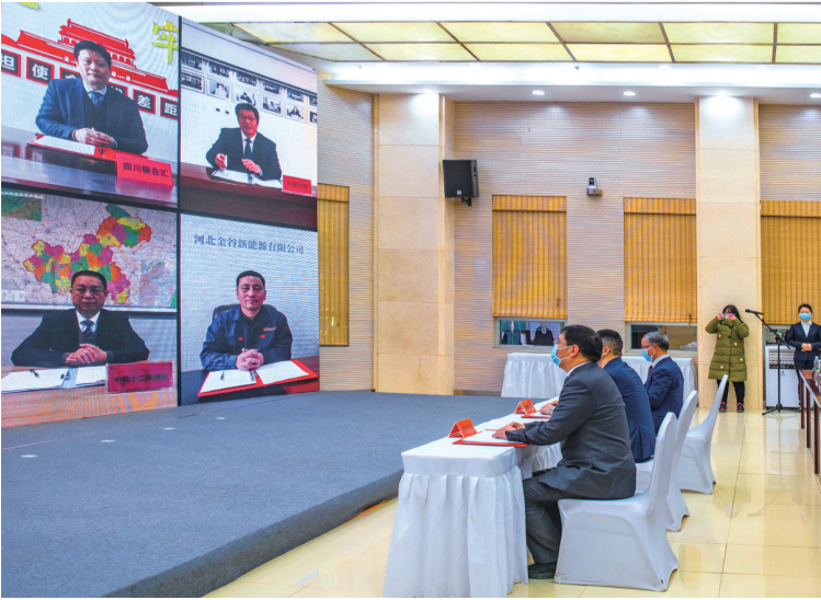
在綦江区第一季度招商引资项目集中签约仪式上,创新经济走廊建设指挥部现场签约9个招商引资项目,总投资233亿元