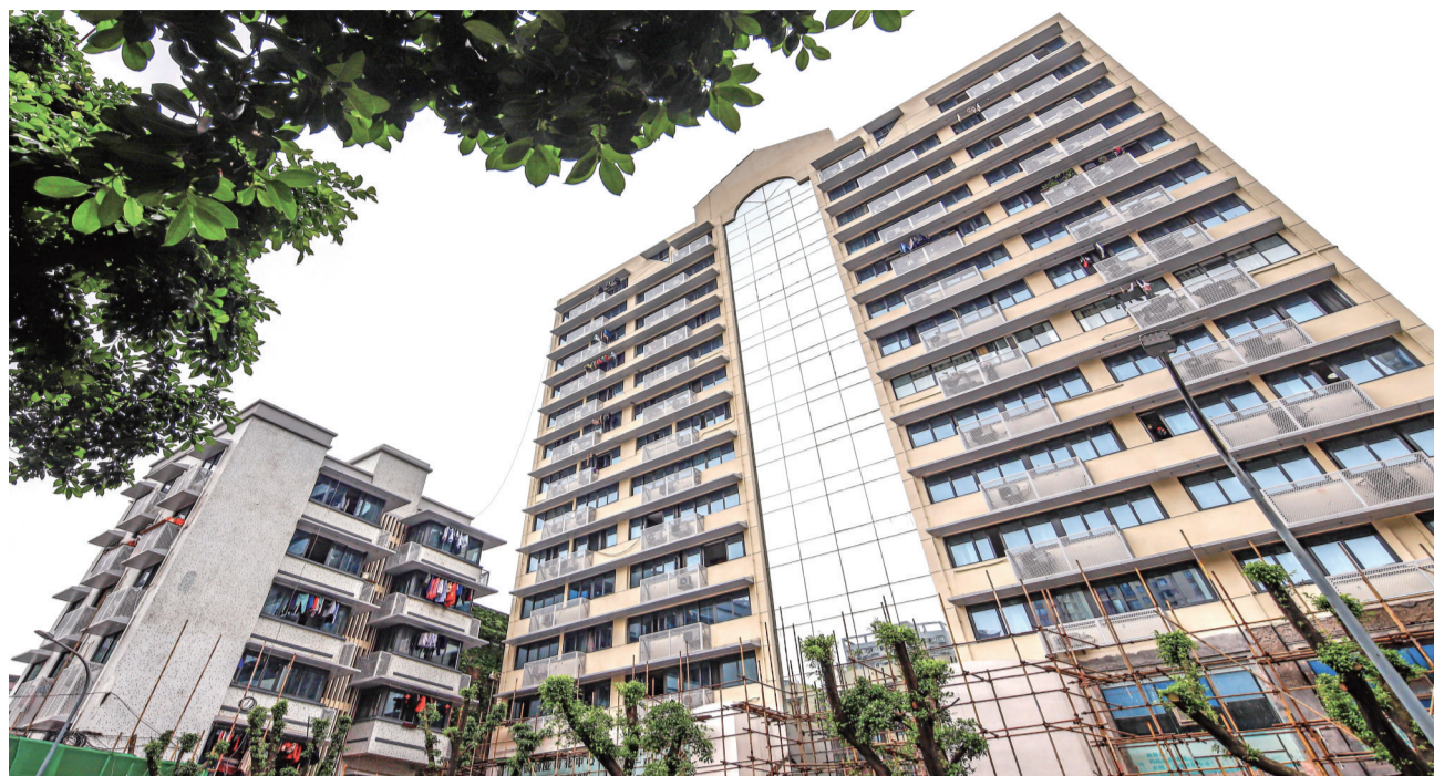
惠心大厦改造现场

从群众关切出发，渝北区住房城乡建设委迅速行动，开工伊始便多次派人现场考察。渝北区重点建设和管线中心专门成立项目部，组建了综合协调、管线迁改、现场管理等专项小组，联动街道、社区网格员、网格员，召开了改造项目工作布置会、协调会数十次，厘清问题、对症下药。