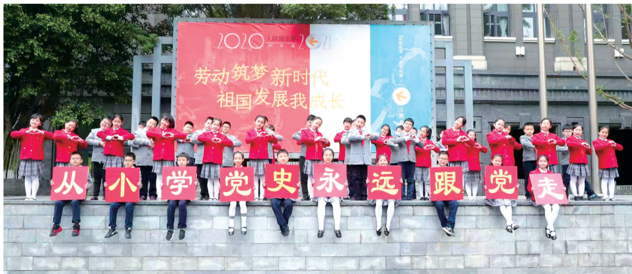
渝中区各中小学开展形式多样的党史学习教育

园党员干部深入街道、社区开展教育政策宣讲28场，结合支部主题党日活动开展“在职党员到社区报到”“网红步道大清扫”等志愿服务活动60余场。