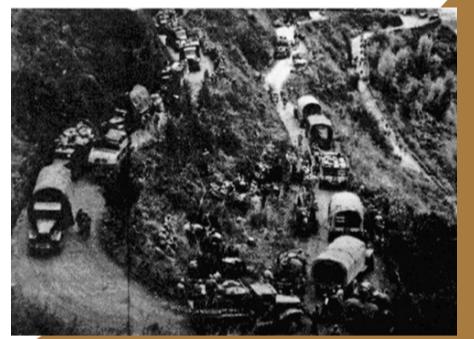
解放军在白马山战役中缴获敌人大量物资装备后,进行清运。

“从宜昌、常德到重庆有两千多里,道路多山,桥梁多被破坏,沿途村庄稀少,运输补给是相当困难的……现在重庆是解放了,而且解放时间比预计的还要快,这是由于毛主席朱总司令的英明指挥,刘、邓、贺诸首长的正确指挥……这样,我们才能在短短的不足一个月的时间内进军两千多里,迅速解放了重庆。”在本次展览中,展出了重庆解放后首任市长陈锡联《关于重庆市接管工作的报告》,其上如是描述。