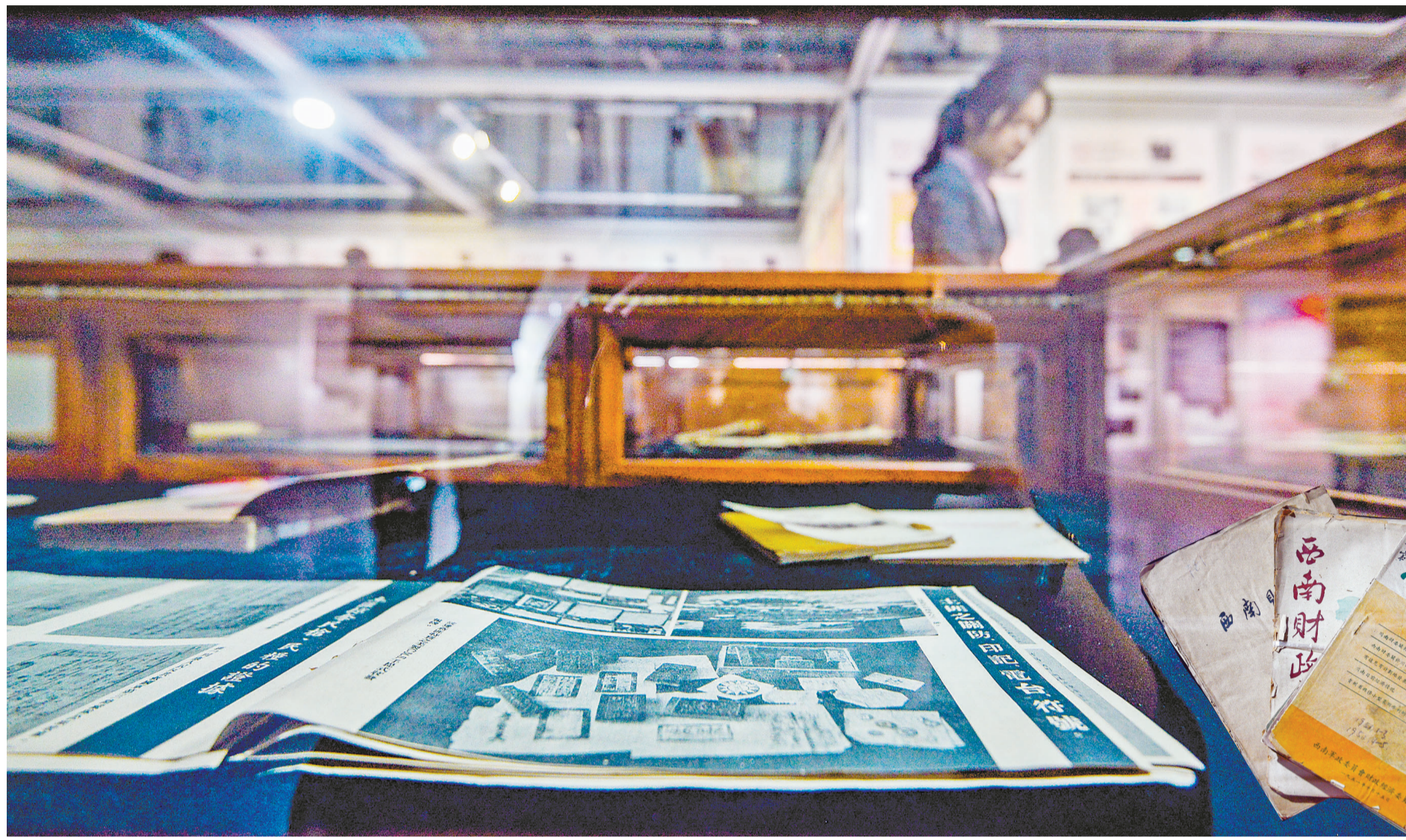
▲《辉煌记忆:重庆图书馆藏西南军政委员会文献展》在重庆图书馆开展。