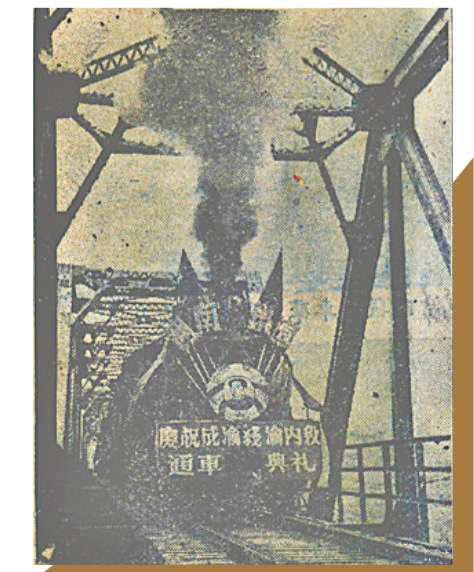
1951年1月12日,成渝铁路渝内段通车。图为第一列由重庆开往内江的火车顺利通过沱江大桥。

“解放大西南、稳定大西南、建设大西南,是新中国成立初期中共中央赋予西南局、西南军政委员会的历史重托。老一辈无产阶级革命家,以大无畏的革命精神,带领西南各族人民,历尽千难万险,在西南大地上谱写了波澜壮阔的历史篇章,他们的功绩理应被铭记。这也是我们这次展览的初衷。”重庆图书馆馆长任竟说。