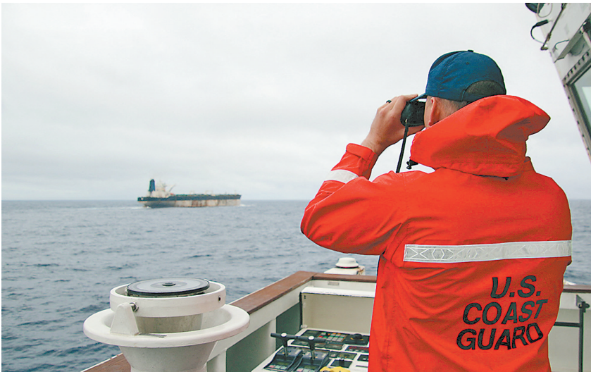
这张美国欧洲司令部1月7日发布的照片显示,一名美国海岸警卫队官员使用望远镜查看“贝拉1”号油轮。

综合新华社1月7日电 美国欧洲司令部7日称,美方已在北大西洋扣押一艘俄罗斯油轮,此次扣押行动系执行美国总统令。