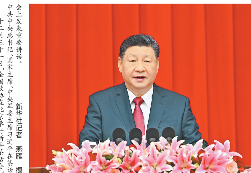
会上发表重要讲话。新华社北京12月31日，全国政协在北京举行新年茶话会。