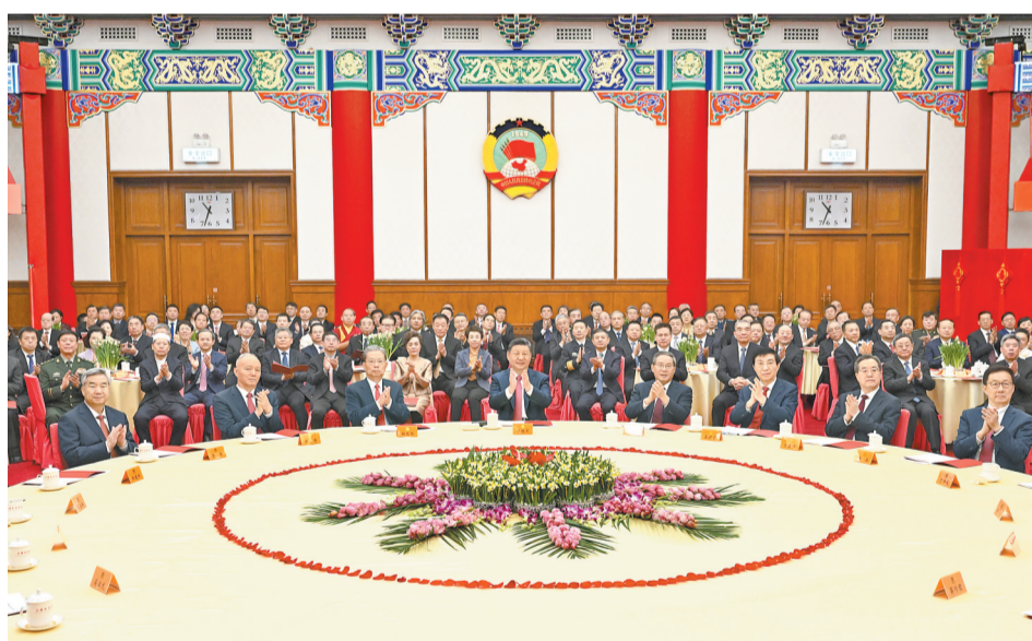
十二月三十一日，全国政协在北京举行新年茶话会。党和国家领导人习近平、李强、赵乐际、王沪宁、蔡奇、丁薛祥、李希、韩正出席茶话会并观看演出。