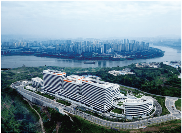
2025年6月25日,九龙坡区人民医院焕新启航

民生为本,枝叶关情。九龙坡区正以一项项民生举措、一次次制度创新,把“中国式现代化,民生为大”转化为城市发展的现实图景,也让高品质生活在城市各个角落不断生长、持续铺展。