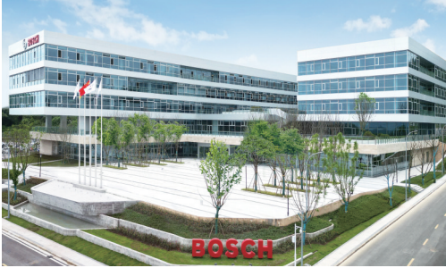
博世氢动力在九龙坡区打造的全球首个氢燃料电池研发制造中心

“十四五”时期是九龙坡发展史上具有里程碑意义的五年。五年来,九龙坡区始终牢记殷殷嘱托,坚决贯彻党中央决策部署和市委工作要求,团结带领全区上下统筹推进经济社会发展各项任务,致力在全市做实“两大定位”、发挥“三个作用”,在奋力谱写中国式现代化重庆篇章中勇挑重担、走在前列。 奋进“十五五”新征程,九龙坡区正以更加清晰的发展思路、更加坚实的发展基础,迈向现代化建设“跨越关口、提升能级”的关键阶段。