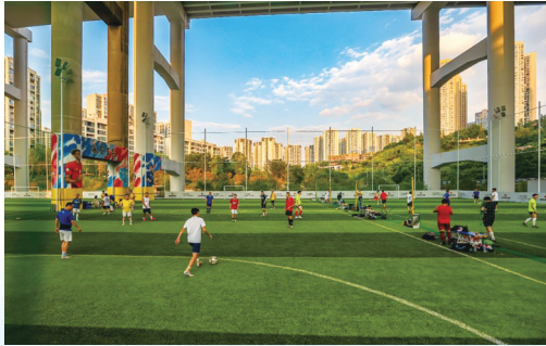
九龙坡区五台山立交桥下闲置空间变身运动公园

当前,九龙坡区正把城市作为一幅山水画整体谋划、整体打造,景区城市的形象气质越来越美,客厅城市的功能品质越来越优,经营城市的效益越来越好,“以城养城、以城建城、以城兴城”迈出坚实步伐。