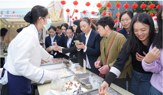
中医药文化集市潼南站药食同源展区

“十四五”时期，重庆市潼南区中医院恪守新时期卫生与健康工作方针，遵循中医药发展规律，锚定“传承精华、守正创新”核心方向，以创建国家三级中医院为重要抓手，构建起“技术提质、赋能基层、文化惠民”的中医发展体系，在医疗服务升级、学科人才建设、中医药文化传播等领域实现跨越式发展，让优质、便捷、高效的中医药服务精准触达群众，成为守护区域健康的重要力量。