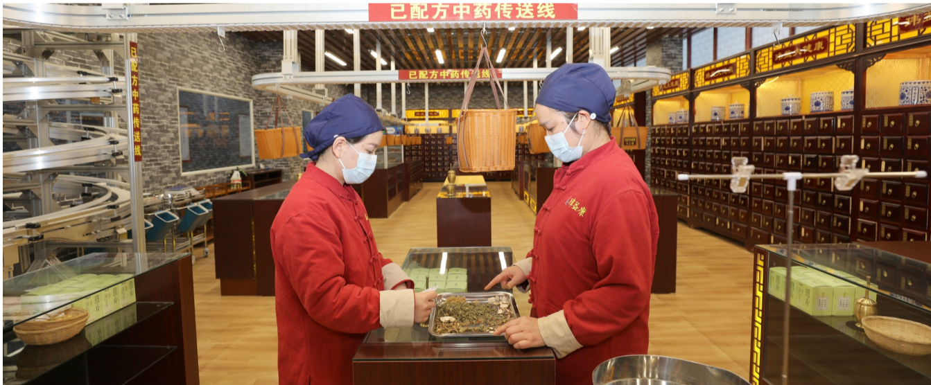
潼南区中医院建成西南地区首家配方颗粒混调医院和区域中药智慧代煎中心

专科建设是对接群众健康需求的关键抓手。医院以“三甲”创建为契机，全力推进名科集群建设，成功打造国家级中医特色专科1个、市级中医重点专科3个、区级重点专科8个，构建起覆盖常见病、疑难病、慢性病的特色专科体系。在此基础上，新增风湿病、老年病、肿瘤等10余个临床科室，形成27个临床学科与10个医技科室协同发展格局，治未病中心入选全市十大治未病中心建设单位，胸痛中心通过省级预检，特色门诊持续扩容，让群众“大病不出区”的期望成功落地。同时，医院持续优化55个中医优势病种诊疗方案和80个临床路径，重点专科优势病种住院中