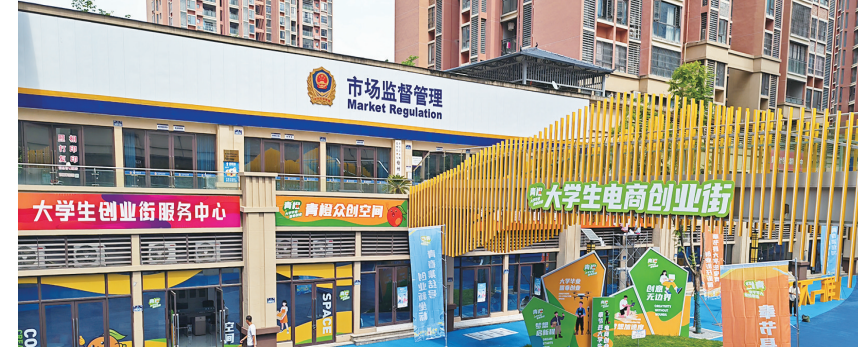
大学生电商创业街，让青年创业团队实现创业梦