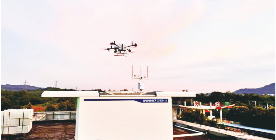
首讯公司在重庆绕城高速忠兴收费站周边利用长续航无人机开展道路巡检，迅速识别拥堵、停车、逆行等道路异常事件