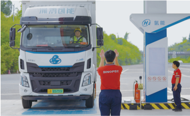
成渝高速走廊上首座加氢站——渝蓉高速高升加氢站正式投用