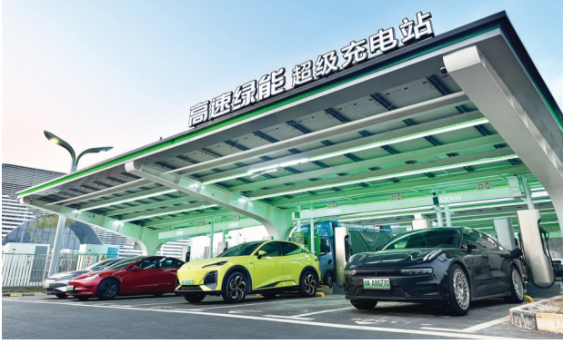
位于G5013渝蓉高速大足石刻服务区的超级充电站