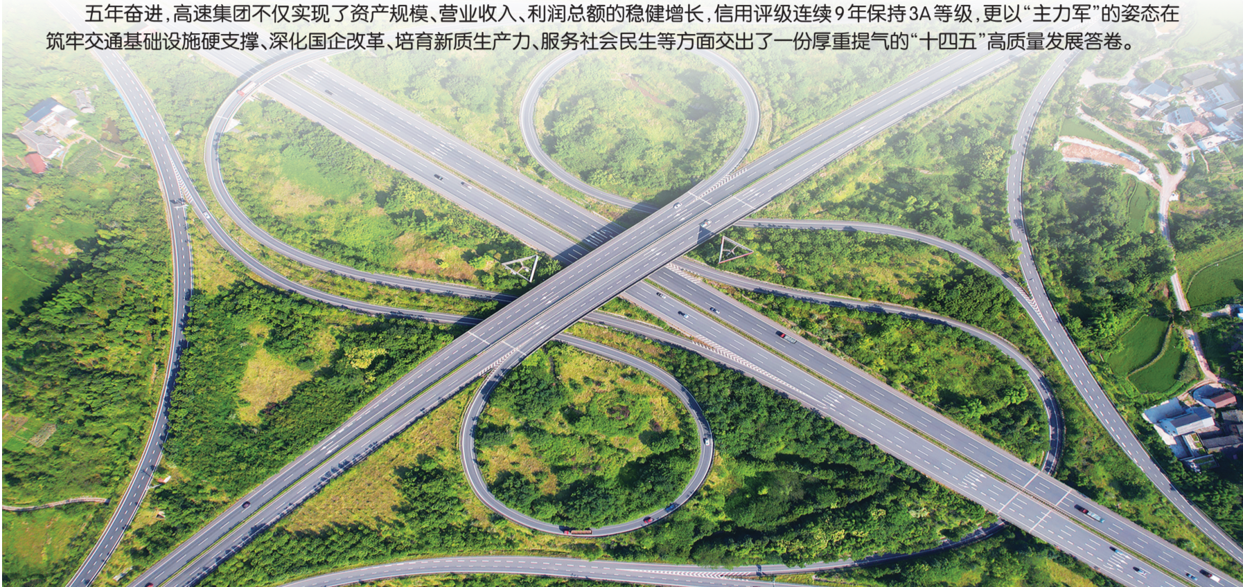
渝蓉高速和三环立交立交桥

五年奋进，高速集团不仅实现了资产规模、营业收入、利润总额的稳健增长，信用评级连续9年保持3A等级，更以“主力军”的姿态在筑牢交通基础设施硬支撑、深化国企改革、培育新质生产力、服务社会民生等方面交出了一份厚重提气的“十四五”高质量发展答卷。