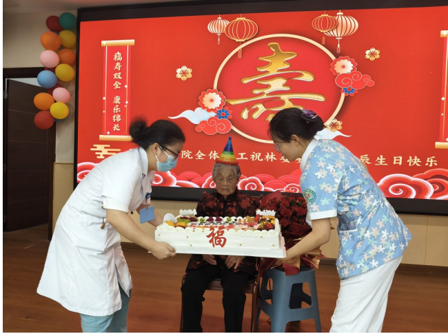
为入住百岁老人送上生日祝福

医养结合的核心在于“医”与“养”的深度融合，云阳县妇女儿童医院充分发挥医疗资源优势，将专业医疗服务贯穿养老全过程，为老年人筑牢健康安全屏障。护理院与医院医疗体系无缝衔