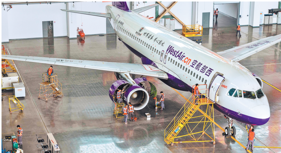
重庆江北国际机场E2机库，海航航空技术(重庆)有限责任公司的技术人员在拆解飞机，拆卸下的部件经严格检测后将作为航材循环利用。该项目规划未来5年将配套建设全国领先的航空资源循环利用基地、区域二手航材交易中心等。