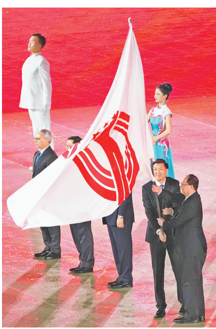
这是十一月二十一日拍摄的闭幕式上的中华人民共和国运动会会旗交接仪式。