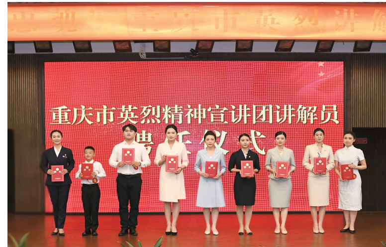
重庆市英烈精神宣讲团讲解员聘任仪式