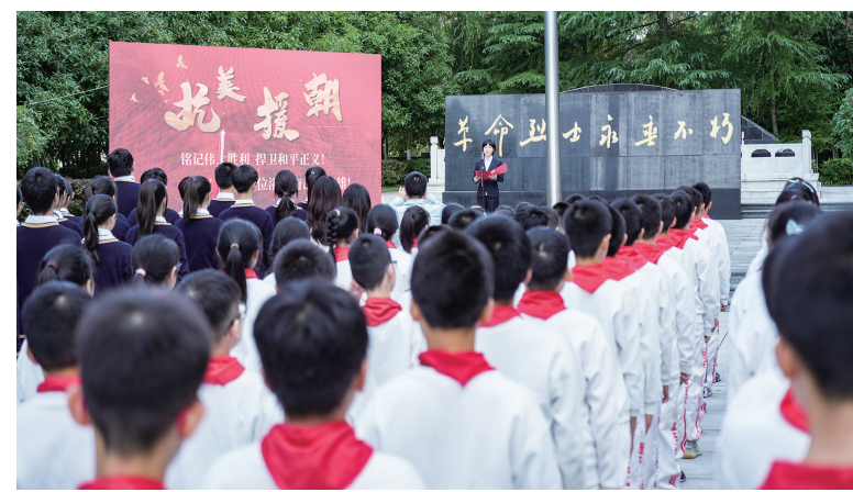
万州区退役军人事务局联合铜梁区退役军人事务局等单位，在万州革命烈士陵园开展“红星闪闪小课堂”行走的思政课活动