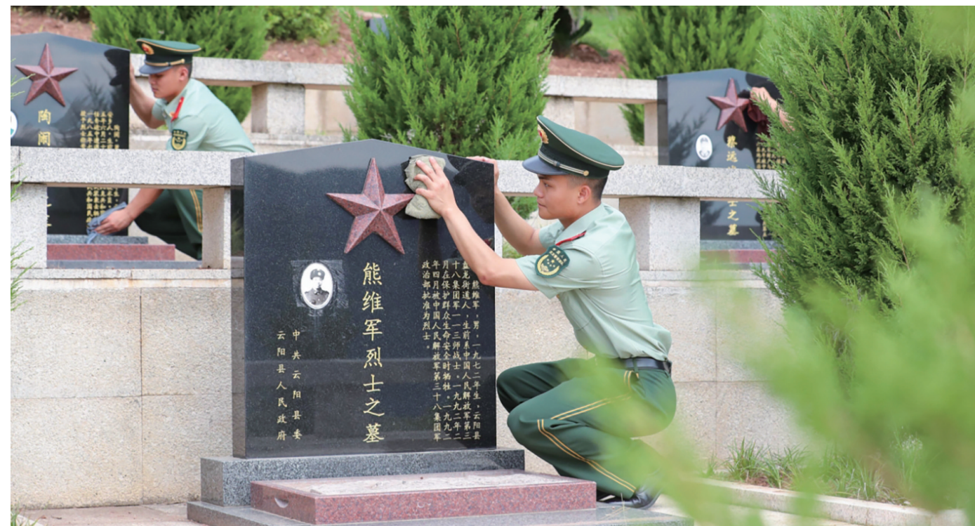
武警重庆总队执勤第三支队官兵来到云阳县烈士陵园开展“缅怀革命先烈、砥砺忠诚担当”教育实践活动

从实体修缮到数字赋能，从分级管理到功能拓展，重庆正在用创新和实践书写烈士纪念设施保护运用的新篇章。一处处焕然一新的纪念设施，不仅生动讲述着英烈的故事，更承载着一个民族的历史记忆和精神追求。