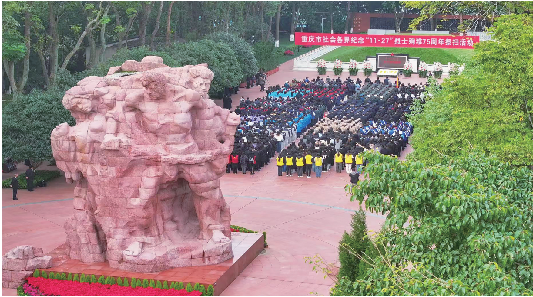
重庆市社会各界纪念“11·27”烈士殉难75周年祭扫活动在歌乐山烈士陵园举行

近年来，重庆充分挖掘和发挥红色资源优势，以高度的政治责任感和历史使命感，用心用情用力保护好、管理好、运用好烈士纪念设施红色资源，大力弘扬英烈精神，让红色基因代代相传，让红色血脉永续流淌，在新时代新征程上谱写了烈士褒扬工作新篇章。