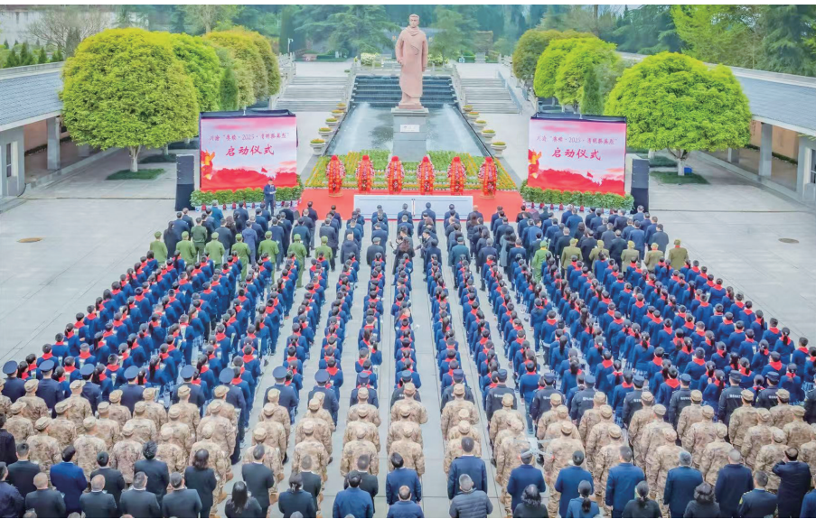
川渝“赓续·2025·清明祭英烈”启动仪式现场

从实体烈士纪念设施到红色文化流动宣讲，从线下活动到线上传播，从成人教育到青少年思想政治教育，重庆正在构建多维度、多层次的红色文化传承体系。通过创新活动形式、拓展覆盖范围、深化教育内涵，让红色文化可感可知、可亲可近，让英烈精神从历史走进现实，从书本融入生活，在新时代绽放出更加璀璨的光芒。