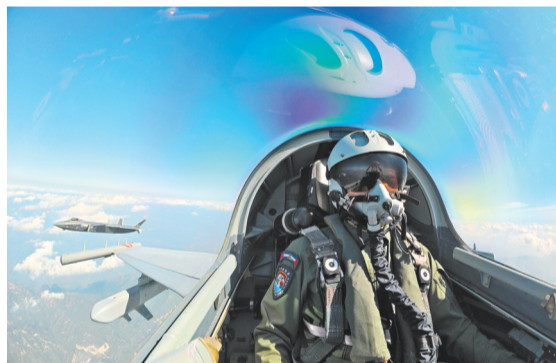
▲歼击机梯队接受检阅。