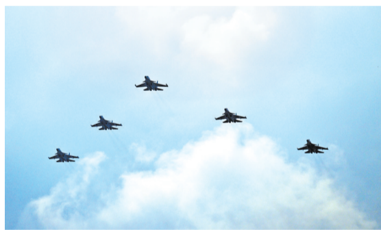
▲舰载机梯队接受检阅。