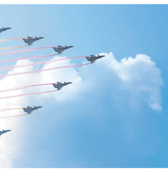
▲教练机梯队接受检阅。