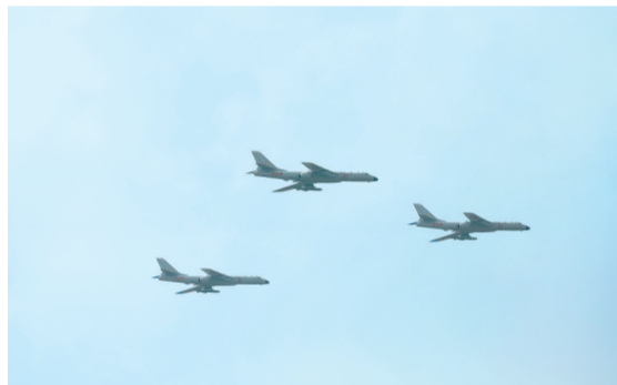
▲轰炸机梯队接受检阅。