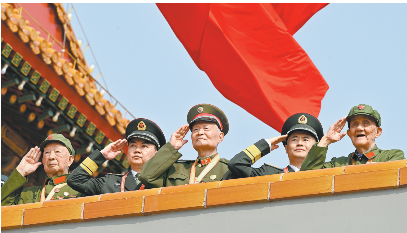
9月3日,纪念中国人民抗日战争暨世界反法西斯战争胜利80周年大会在北京隆重举行。这是观礼嘉宾在天安门城楼上敬礼。