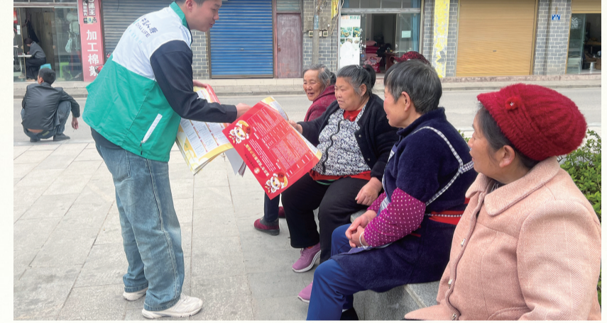
中国人寿寿险城口县支公司开展“惠民济困保”宣传