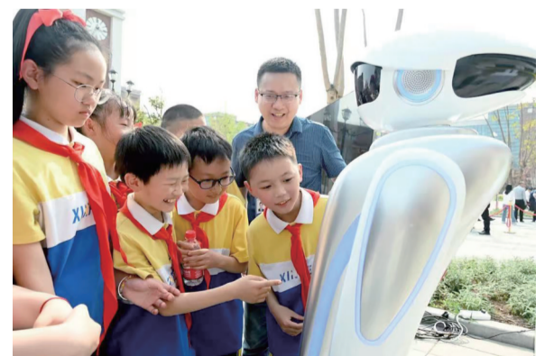
智慧养老情感陪护机器人促进“人工智能+消费”

为促进城市新市民就业,公司推出“逸驱Job”平台,累计帮助11.4万蓝领群体匹配岗位;捐赠情感陪护机器人“裴裴”,为养老院老人提供涵盖智能情感陪伴、数字素养提升、健康安全守护、娱乐休闲服务、生活辅助管理等5大模块的服务体系;发起“千里马·乡村英才计划”,依托自研的音视频直播平台,面向小镇青年、返乡创业者等群体免费开展金融知识普及、职业技能等在线培训超万人次。