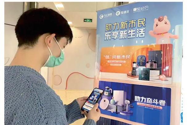
助力新市民乐享新生活

在深耕普惠金融领域,马上消费聚焦新市民、新就业大学生等人群,提供灵活便捷的小额零售金融产品,通过数字化赋能提升服务质效,增强金融服务的触达性和可获得性。截至2024年底,累计服务超过2亿用户,遍布全国31个省级行政区划,带动商品交易额过万亿元。