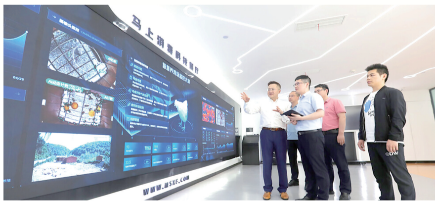
“富慧养”智慧养殖项目荣登农业农村部智慧农业典型案例

马上消费充分发挥在数字金融领域的优势,加大力度与高校和科研机构紧密合作,共同推动数字技术创新和应用。