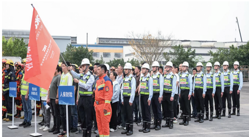
重庆市应急管理局向人保财险重庆分公司应急救援队授旗