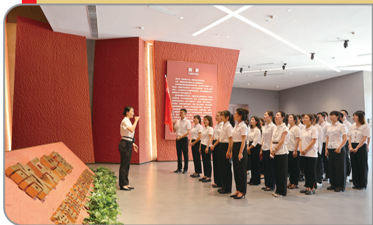
沙坪坝区开设“行走红岩”思政大课堂，抓实“双培养”工程，打造高素质党员队伍