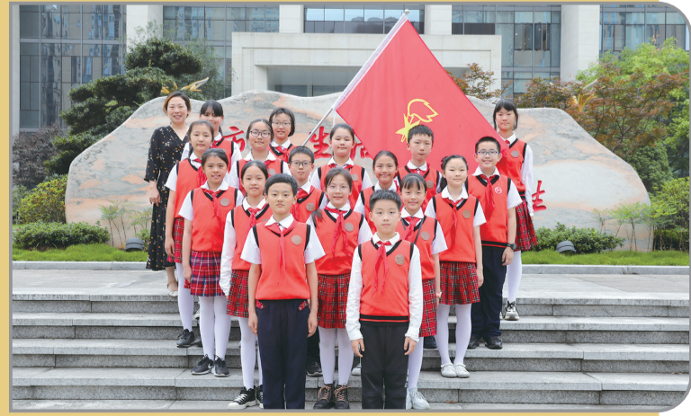
铜梁区第一实验小学以“七彩党建”照亮孩子美丽童年