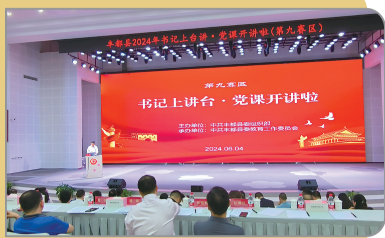
丰都开展“书记上讲台·党课开讲啦”活动

新征程上，沙坪坝区对标全国教育顶尖区域，以高质量党建推动沙坪坝教育高质量发展，积极服务和融入教育强国建设。