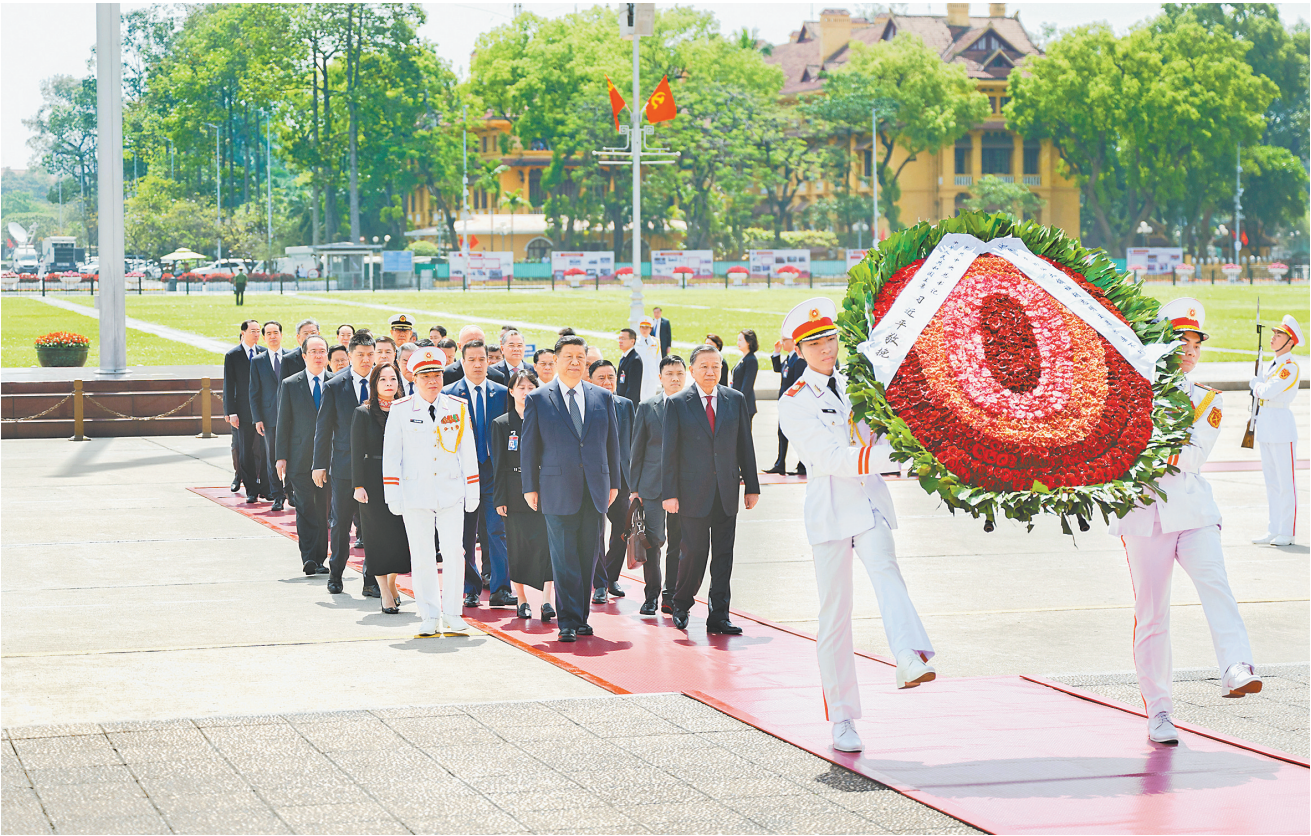
4月15日上午，在越共中央总书记苏林陪同下，中共中央总书记、国家主席习近平瞻仰胡志明陵并敬献花圈。