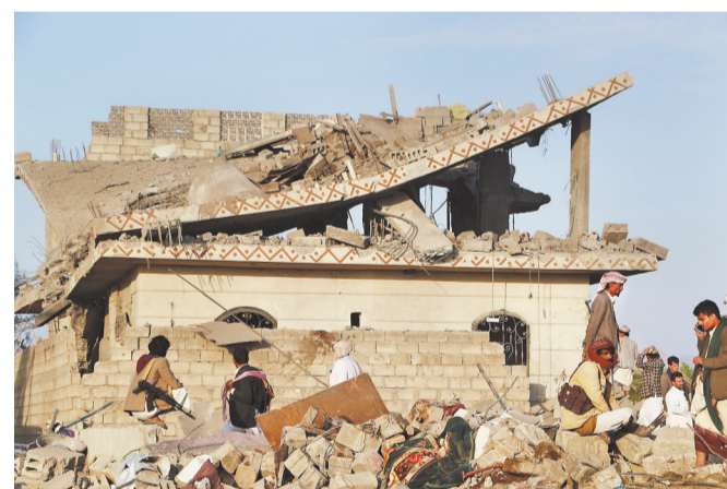
三月十六日,在也门首都萨那,人们在被美国空袭后的房屋废墟中。新华社路透

也门胡塞武装发言人叶海亚·萨雷亚当天在该组织控制的马西拉电视台发表声明说,美军自15日以来已对也门发动至少47次空袭,空袭了首都萨那及其他7个省份,空袭已造成53人死亡,另有98人受伤。作为回应,该组织16日使用18枚弹道导弹和巡航导弹及一架攻击无人机袭击了位于红海的美国“哈里·杜鲁门”号航空母舰及其随行舰只。