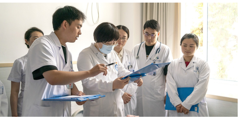
华西医院专家团队来到重庆大学附属黔江医院现场指导

医院建立“2+2+3”向上借力模式,挂牌重庆大学附属黔江医院、吉首大学第三临床学院,与四川大学华西医院、重医附二院两家大型综合性医院建立紧密合作关系,与重庆大学附属肿瘤医院、重医附属儿童医院、重庆市急救中心三家专科特色突出医院,建立分院、分中心形成帮扶指导关系。高等院校的科研引擎、高水平医院的帮扶下沉、专科医院的技术支援,