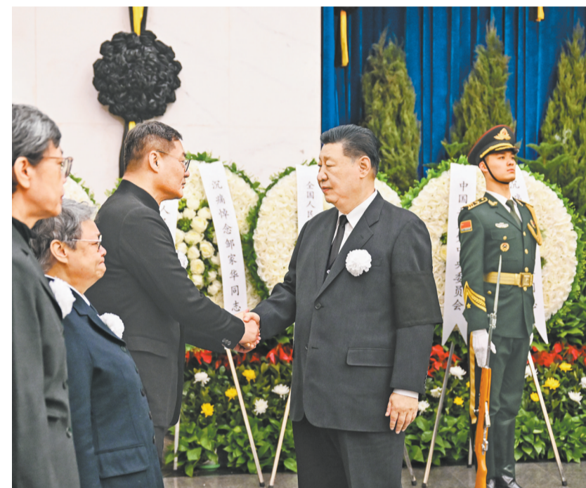
2月20日，邹家华同志遗体在北京八宝山革命公墓火化。习近平、李强、赵乐际、王沪宁、蔡奇、丁薛祥、李希、韩正等前往八宝山送别。这是习近平与邹家华亲属握手，表示深切慰问。

邹家华同志病重期间和逝世后，习近平李强赵乐际王沪宁蔡奇丁薛祥李希韩正胡锦涛等同志，前往医院看望或通过多种形式对邹家华同志逝世表示沉痛哀悼并向其亲属表示深切慰问