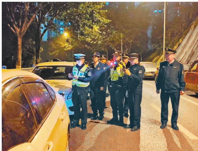
沙坪坝区消防救援、交巡警、城市管理等部门会同镇街开展堵占消防车通道夜间联合整治行动。