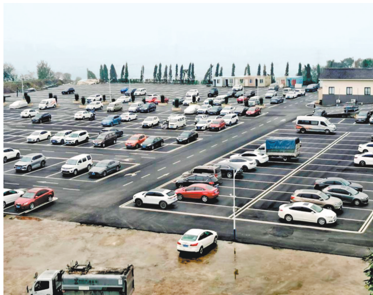
秩序井然的两江新区南山智慧停车场。