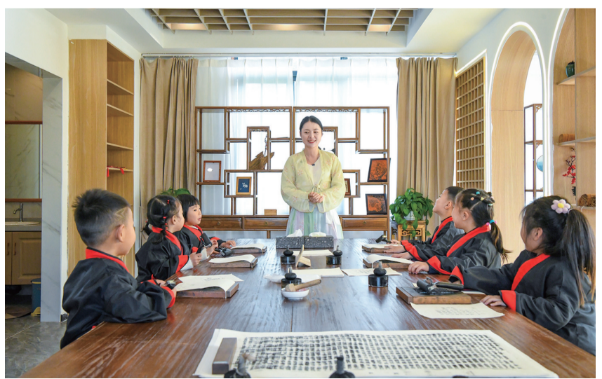
果蔬书院汉字文化研学活动