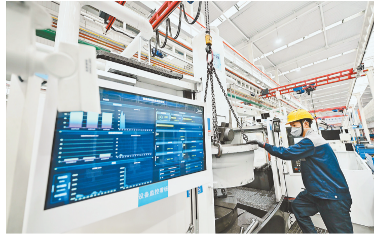
重庆美的通用制冷设备有限公司智造工厂。(资料图片)

本报讯 (新重庆-重庆日报记者 夏元)1月21日,市经济信息委公布消息称,日前世界经济论坛公布新一批全球“灯塔工厂”名单,重庆美的通用制冷设备有限公司(以下简称重庆美的通用)水机智造工厂上榜。这是全球中央空调冷水机组行业首座全流程AI赋能的“灯塔工厂”,也是我市首个“灯塔工厂”。