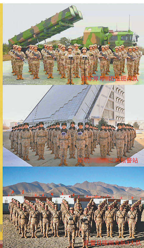
1月24日，中共中央总书记、国家主席、中央军委主席习近平到北部战区机关视察慰问，通过视频看望基层官兵，检查部队战备值班和执行任务情况，代表党中央和中央军委，向全体人民解放军指战员、武警部队官兵、军队文职人员、预备役人员和民兵致以诚挚问候和新春祝福。这是习近平同南部战区陆军某旅任务分队、