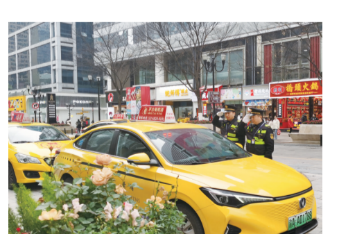
直属支队在解放碑等窗口地区开展“护窗”行动，大力整治出租汽车乱象

“红岩先锋队”带领重庆“雷锋的士”志愿服务队坚持数十年如一日，以优质的服务和爱心行为绘就流动的文明风景线，点亮了重庆这座超大城市的每一处角落。