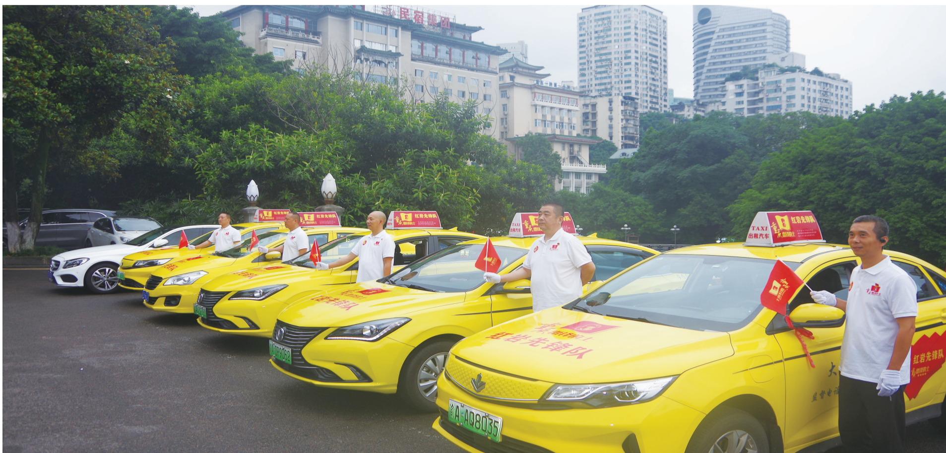
交通执法与出租车协会共同打造“雷锋的士·红岩先锋队”提升城市形象、擦亮城市名片