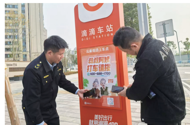
“滴滴车站”在寸滩街道丽苑社区投用，方便居民出行