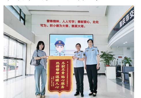
乘客向为其找回遗失在出租车上贵重物品的执法人员送上锦旗