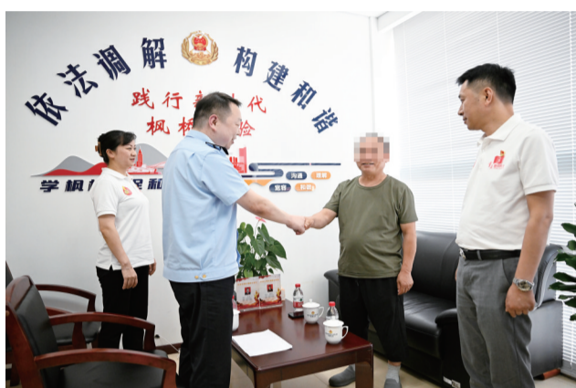
重庆中心城区首个“交通运输纠纷调解室”投用

超大城市治理是世界级难题。党的二十届三中全会提出，“推动形成超大特大城市智慧高效治理新体系”。市委六届五次全会提出，重庆要打造超大城市现代化治理示范区，提高城市基层精细化治理、精准化服务水平，加强城市文明建设，加快打造宜居韧性智慧的国际化大都市。