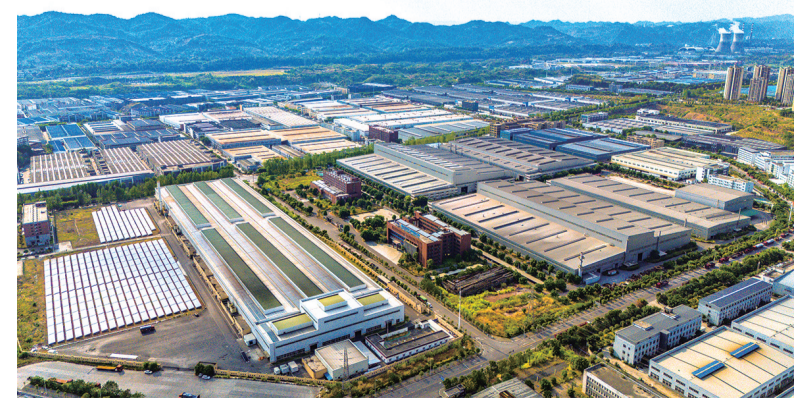
珞璜工业园厂房林立

据介绍,重庆枢纽港产业园位于 重庆中心城区与渝西地区交汇处, 是重庆打造新时代西部大开发 重要战略支点、内陆开放综合 枢纽“两大定位”的标志性工程。 园区呈“一区两廊”空间布 局,其中“一区”是先行区,涵 盖长江以南江津支坪片区、珞 璜片区,长江以北九龙坡西彭 片区;“两廊”是南北向科学 大道走廊和东西沿江产业走 廊。