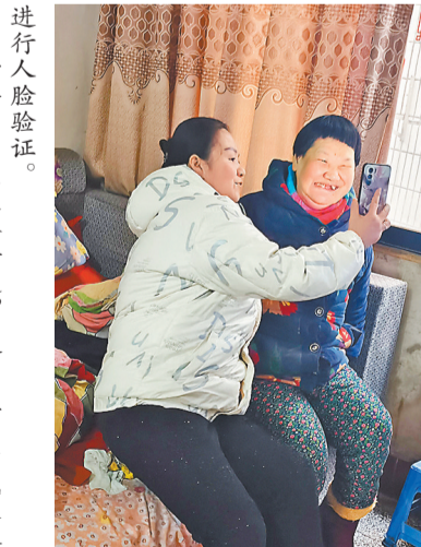
进行人险验证。沙坪坝区陈家桥街道，网格员正帮助残疾人

“数智赋能如何更好为基层工作者减负，更好助力基层治理发挥最大效益，我们还将继续探索思考。”采访中，基层工作者普遍肯定一系列减负举措带来的实效，希望基层减负能持续深入、取得更多成效，让基层腾出时间更好服务群众。