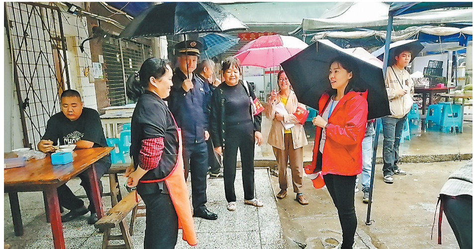
在对市场进行综合整治前，巴南区土桥正街社区工作人员走访经营者，听取他们的建议。