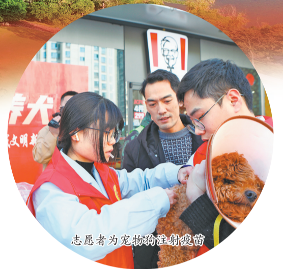
志愿者为宠物狗注射疫苗

不久前,永川区公安局双石红炉永荣派出所联勤组民警将一只走失犬只顺利送回主人身边。