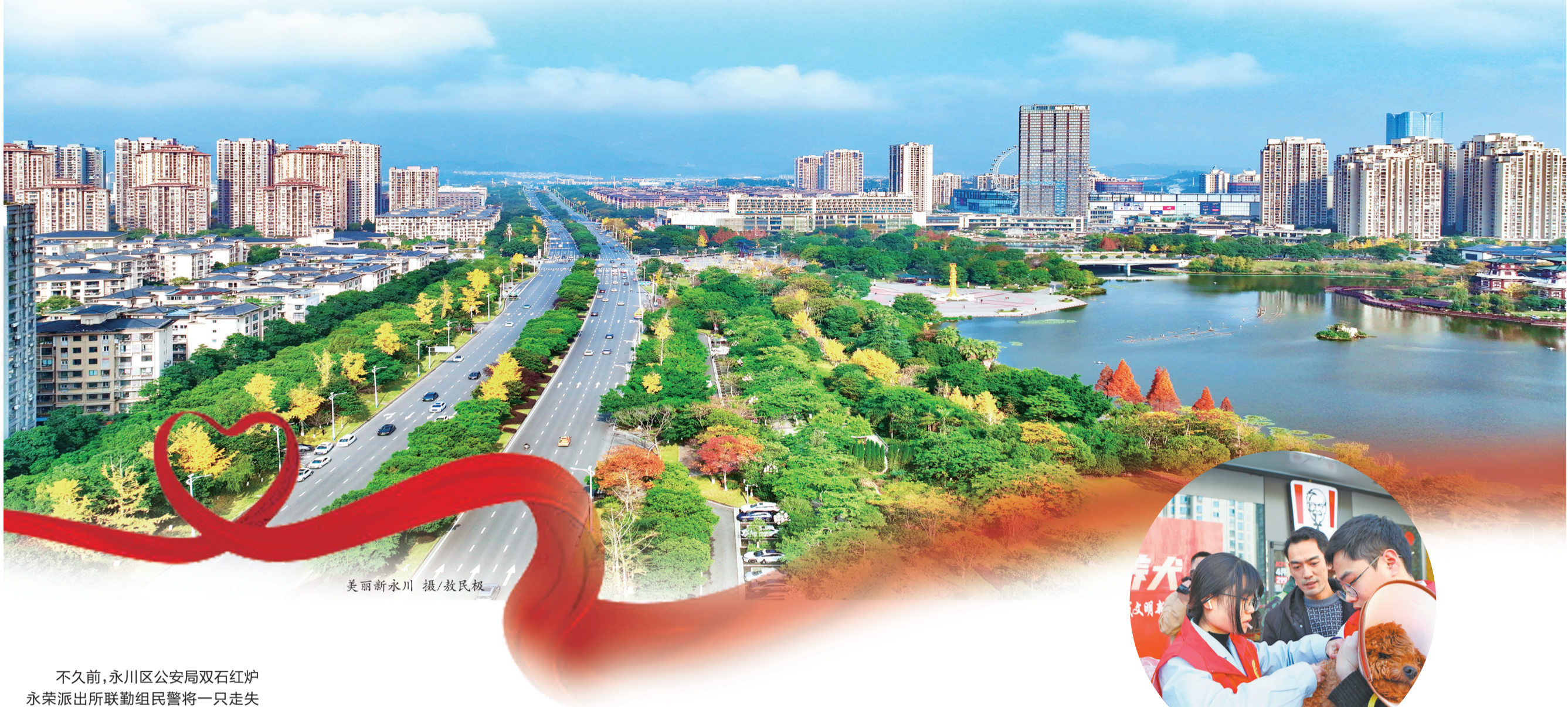
美丽新永川