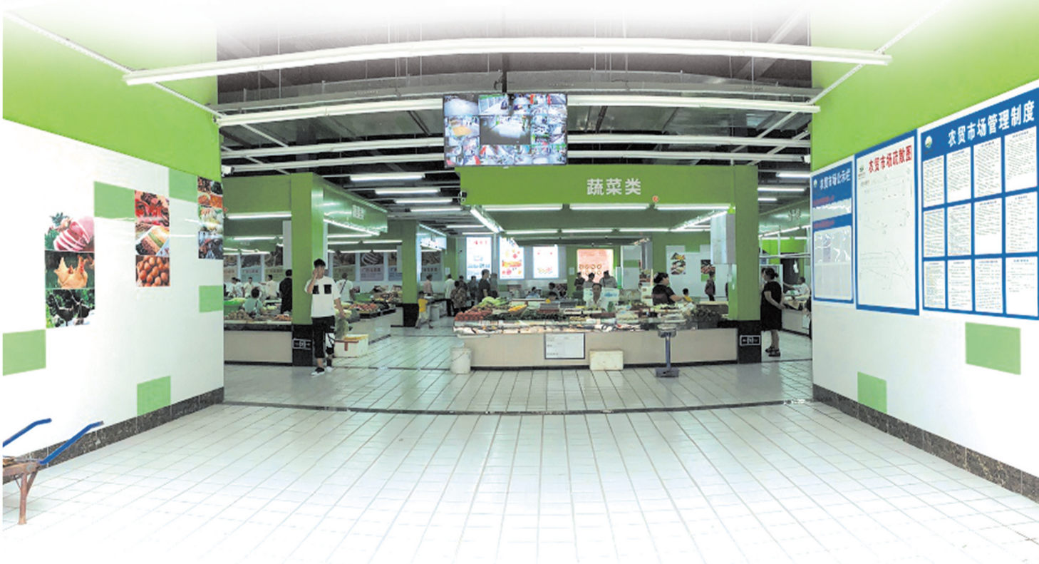
干净整洁的陈食街道农贸市场

塑料瓶、废纸箱、旧衣物……这些被永川居民通过垃圾分类筛选出来的废弃物品,如今有了智能回收新途径。