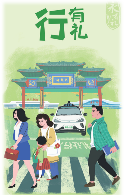
“永有礼——出行讲秩序 交规放心上”宣传画

“永有礼”全域文明新实践活动开展以来,聚焦人民群众关切、反映强烈的身边“小案小事”,引导城乡居民文明习惯养成和文明风尚培育,全面提升基层治理水平和居民文明素质,不断提升全区文明程度,取得了良好的效果。