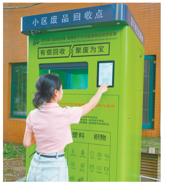
小区里的环保智能再生资源回收柜