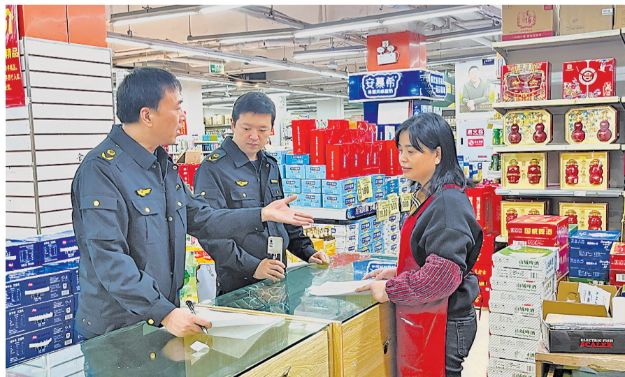
綦江区市场监管局执法人员开展案件回访工作

去年8月，该案例成功入选重庆市市场监管领域服务型执法十大典型案例，成为綦江区市场监管局探索服务型执法新