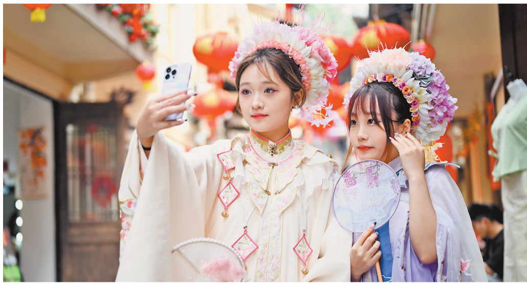
南岸区敦厚坡老街作为重庆首个“簪花一条街”,吸引了大量游客前来打卡。

作为重庆首个“簪花一条街”火爆全网,这里也存在环境卫生、消防安全、治安隐患等方面问题,如何实现商居共赢