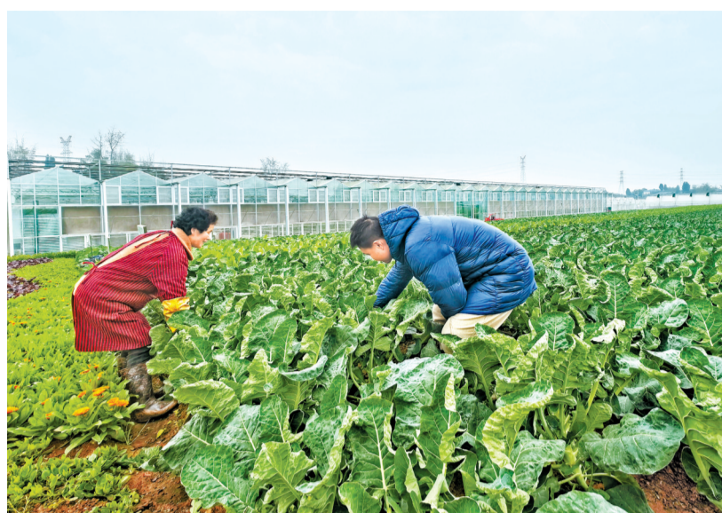
12月30日，中国农业科学院蔬菜花卉研究所西南研发中心工作人员正在查看新品种西兰苔的长势。