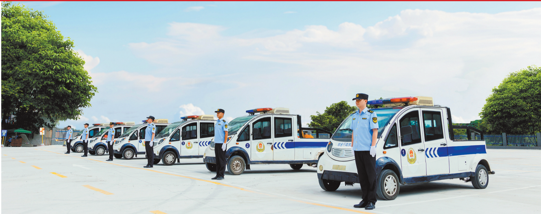
江北区统一行政执法装备。