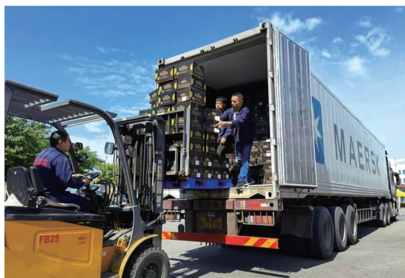
汇达柠檬的工人把出口的柠檬装入车厢。

近年来,潼南区多部门联动,对原有柠檬种植园开展标准化改造并进行了柠檬出口基地备案。尤其是今年,潼南区商务委、区农业农村委联动海关,开展“潼南区柠檬出口备案基地倍增行动计划”。截至目前,全市28个柠檬出口备案基地,潼南就占了27个。“通过以上行动计划的开展,为潼南柠檬走向全球提供了大量、稳定的