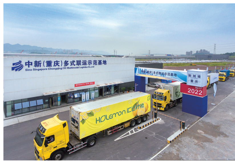
汇达柠檬通过中新(重庆)多式联运示范基地以集装箱的方式运往东南亚。

共建“一带一路”倡议的提出,潼南区迎来了重大发展机遇。2017年,首批运载柠檬的国际公路直达专车从潼南出发前往俄罗斯,当年开通运营的西部陆海新通道,将重庆与东南亚国家的运输距离缩短到10余天;2019年,以重庆和新加坡为双枢纽的“中国西部—东盟”农产品贸易服务平台建成运行,丰富了潼南柠檬的出口路径;2019年潼南区与重庆海关签订《共建