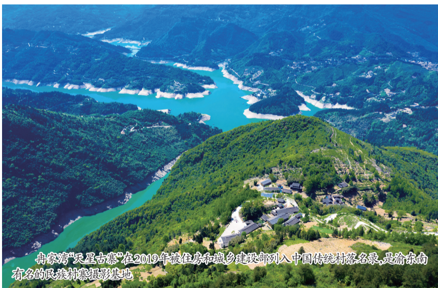
冉家湾“天星古寨”在2010年被住房和城乡建设部列入中国传统村落名录，是渝东南有名的民族村寨摄影基地

近日，市住房城乡建委下达2024年传统村落保护发展项目，铜锣村冉家湾成功上榜，这座历史悠久的村落正迎来保护与发展的新机遇。未来在市、区住房城乡建委的大力支持和指导下，铜锣村将通过传统村落保护与发展并举、环境整治与生态修复同步、乡村振兴与现代治理融合，走出了一条守护历史与展望未来的乡村振兴之路。让村落不再只是记忆，更焕发出新时代高质量发展活力。