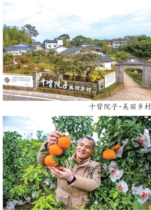
村民在硕果累累的果园中，脸上洋溢丰收的喜悦

如今，肖家镇的滨河环境、道路状况得到了显著改善，干净整洁的街道、绿意盎然的景致、鲜花盛开的景象，俨然成为了居民们休闲健身和饭后散步的理想之地。