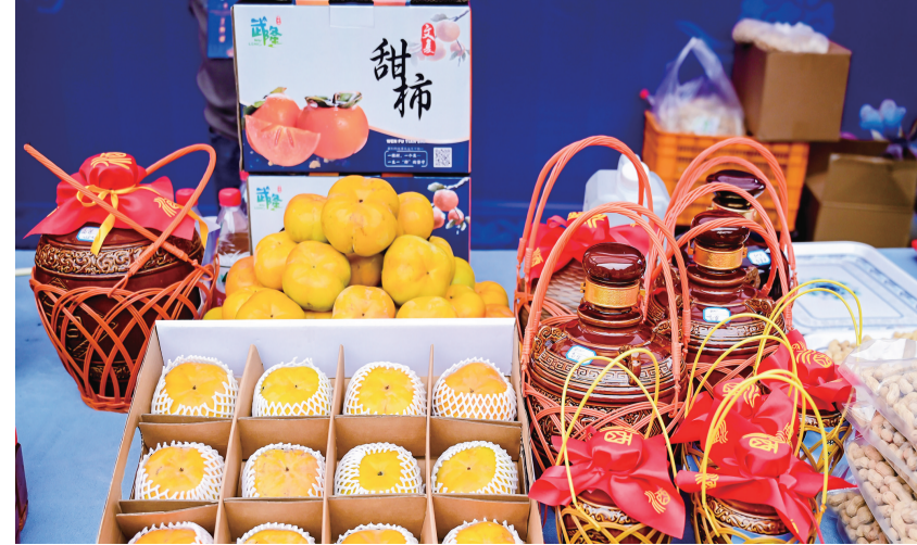
文复乡甜柿种植历史悠久、规模大，是远近闻名的“甜柿之乡”