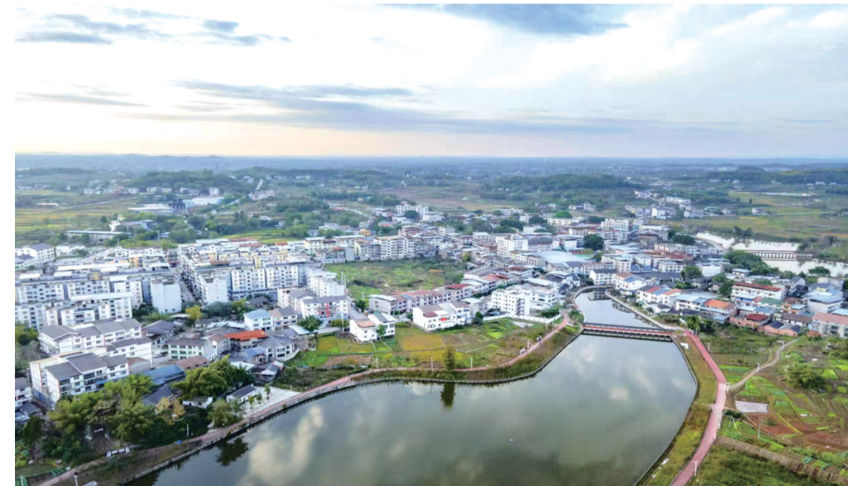
美丽宜居的肖家镇

“卢作孚先生所展现的勤劳、节俭、正直、正义等精神品质，深深地影响着肖家人民。”肖家镇相关负责人说，为了更好地推动全镇镇域环境提升，肖家镇深入挖掘卢作孚文化的深厚底蕴，结合其精神内核打造了“相邻相亲·甜满初心”党建品牌，重新命名规范了街道和场所名称，如启蒙街、启航街、思卢街等，并新建了作孚实践教育园、作孚学堂，保护修缮了卢作孚祖屋等历史文化地标。这些场所不仅为当地居民提供了休闲娱乐的好去处，丰富了居民的精神文化生活，更成为传承和弘扬卢作孚精神的重要平台。