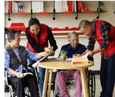
医养中心志愿者陪伴老人