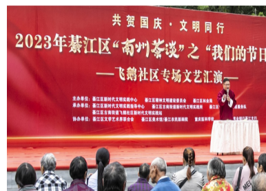
“南州茶谈”活动现场

出基层慢病微宣讲新路径。未来，綦江区将继续深化此品牌，推出更多贴近民生的宣讲活动，让健康理念深入人心，实现健康知识“飞入寻常百姓家”。