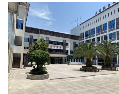
巫山县官渡镇中心卫生院外景