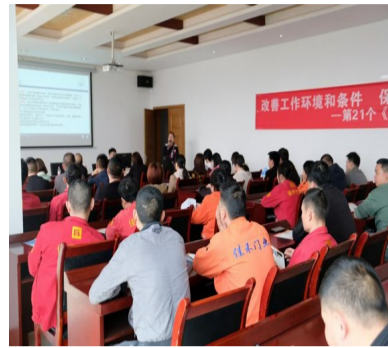
《职业病防治法》宣讲进企业