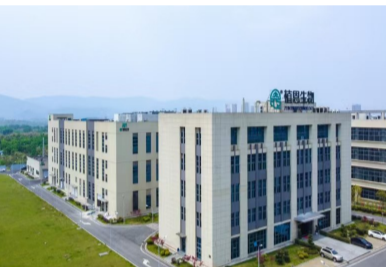
植恩生物技术股份有限公司现代化厂房

相关原料药出口40多个国家和地区，B端业务覆盖超过20万客户，C端业务交易用户规模超2400万人。植恩生物将继续在MAH整体解决方案服务商的路上砥砺前行。