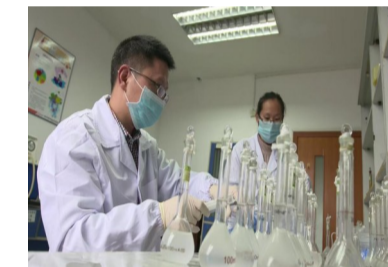
科技工作人员做实验

下一步，康刻尔将继续加大在科技创新方面的投入，为全球代谢性疾病患者提供更多优质、安全的药物。