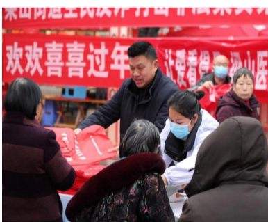
开展“你健康我守护”爱心义诊活动