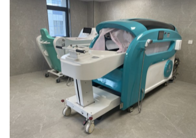
失能老人专用洗浴机

康复事业的蓬勃发展。将持续探索与创新，为更多老年人及康复患者创造更加便捷、安全、舒适的生活环境，助力养老康复行业迈向全新的发展高度。