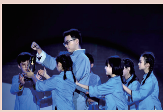
重庆一中红色剧目学子事创演《一中红·赤子心·先行者》