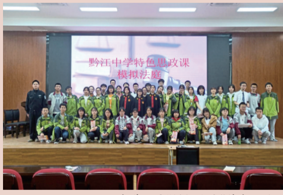
黔江中学开展“模拟法庭”特色思政课