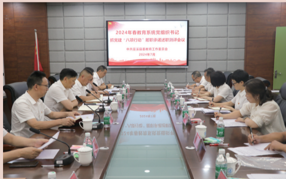
巫溪开展2024年教育系统党组织书记述职会