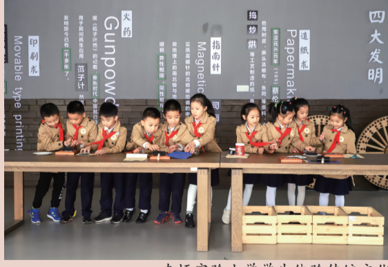
南坪实验小学学生体验传统文化