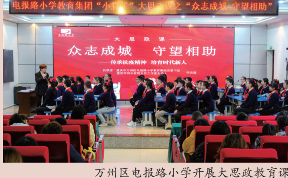
万州区电报路小学开展大思政教育课

念，挖掘学校“立人教育”特色，打造“圆善红烛 立人先锋”党建品牌，引导党员教师不忘党员初心本色，发挥“红烛”精神。