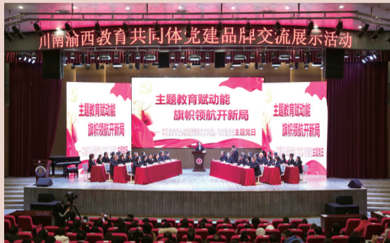
江津区开展川南渝西教育共同体党建品牌交流展示活动