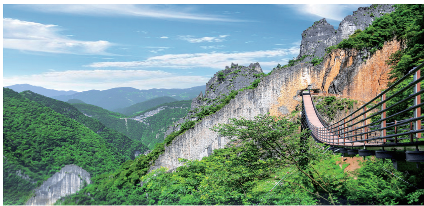
武陵山大裂谷天门洞索桥