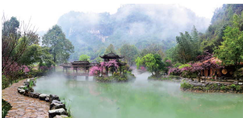
酉阳桃花源国家5A级旅游景区