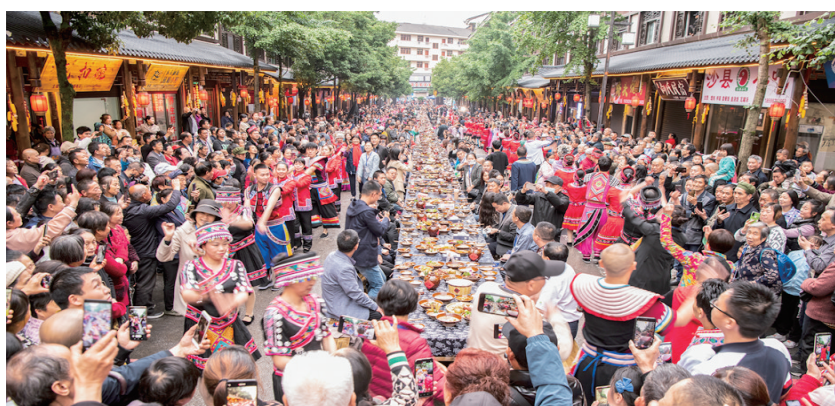
石柱土家千人长桌宴