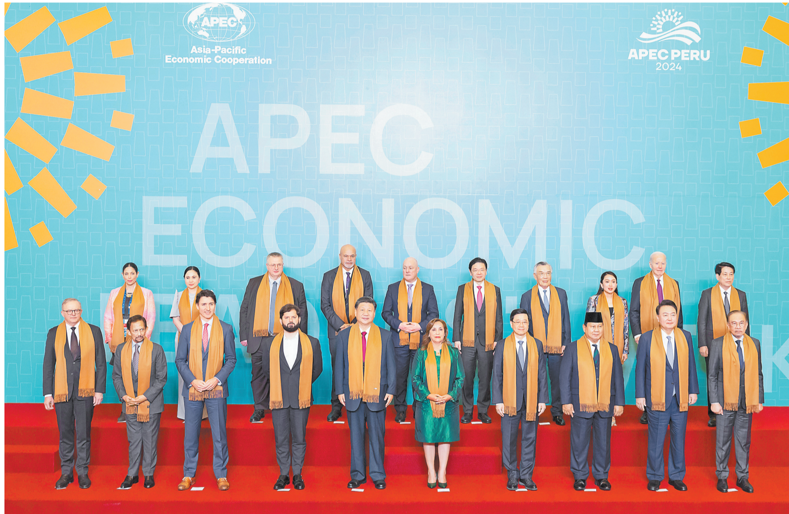
当地时间11月16日上午，亚太经合组织第三十一次领导人非正式会议在秘鲁利马会议中心举行。国家主席习近平出席会议并发表题为《共担时代责任 共促亚太发展》的重要讲话。