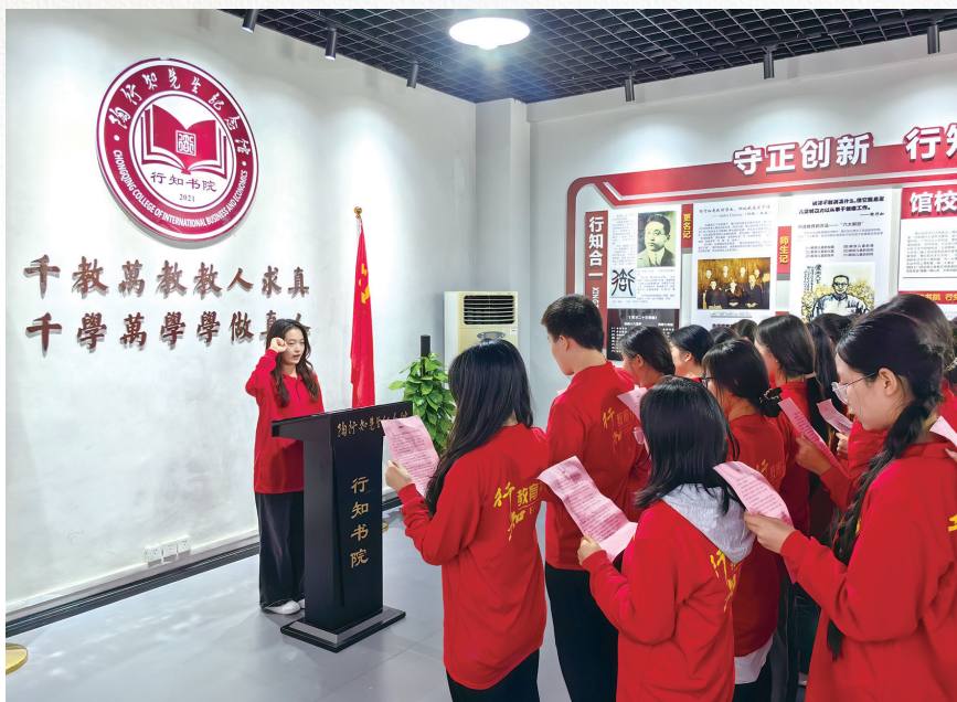
新生入学宣誓活动在该校行知书院举行

奋进在建设教育强国、教育强市的新征程中，重庆对外经贸学院聚焦教育、科技、人才“三位一体”部署，深入实施“党建工作领航、办学质量提升、留院青苗成才”三项行动，落实立德树人根本任务，全力推进教育部本科教学工作合格评估，实现综合实力新跃升，向着创建在“一带一路”有重要影响力的特色应用型大学目标迈进。