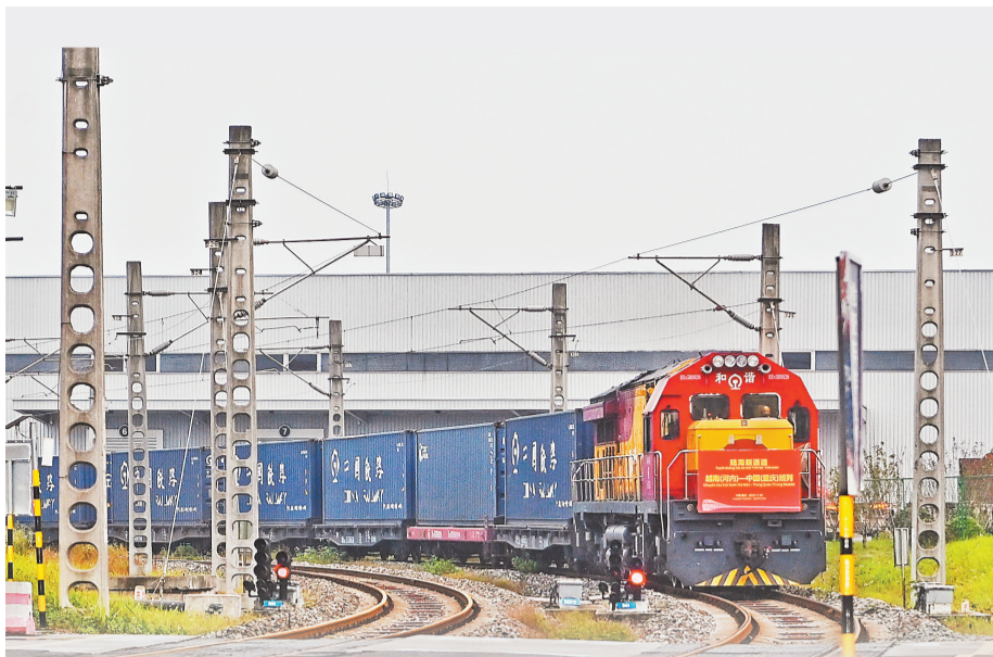
11月8日,陆海新通道越南(河内)—中国(重庆)班列缓缓驶进重庆团结村中心站。该班列共26个标箱,满载中控台控制屏、卷料筒、玩具等越南产品,货值近9000万元。